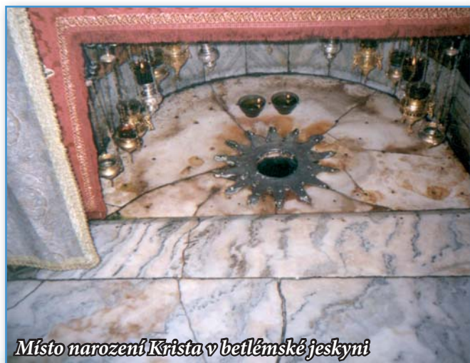
Místo narození Krista v betlémské jeskyni