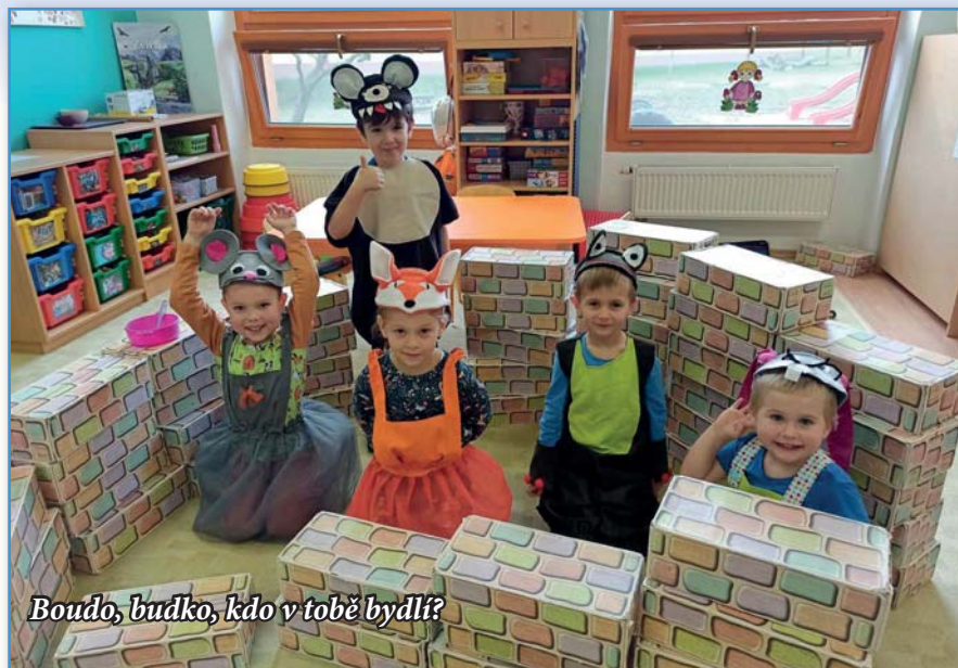
Bouďo, budko, kdo v tobě bydlí?