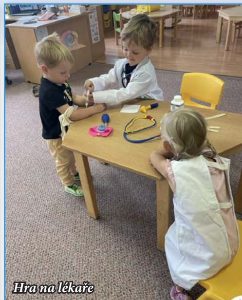
Hra na lékaře