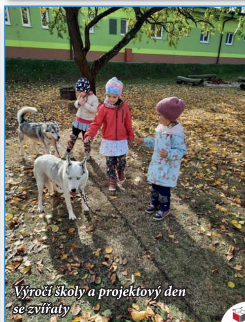
Výročí školy a projektový den se zvířaty