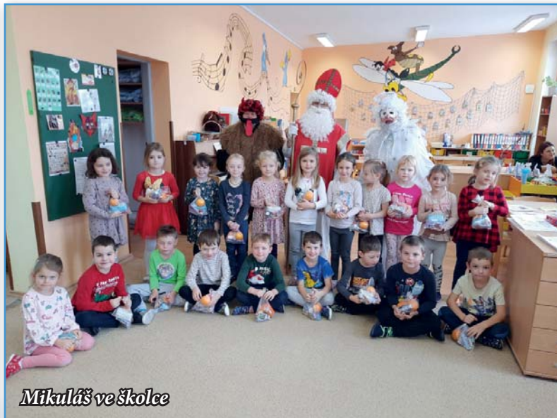
Mikuláš ve školce