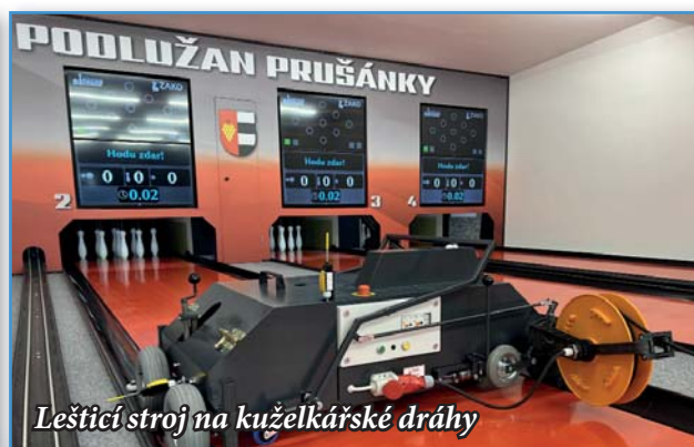
Leštící stroj na kuželkářské dráhy