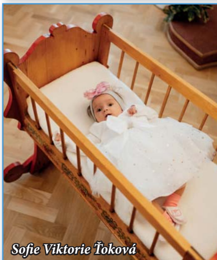
Sofie Viktorie Ťoková