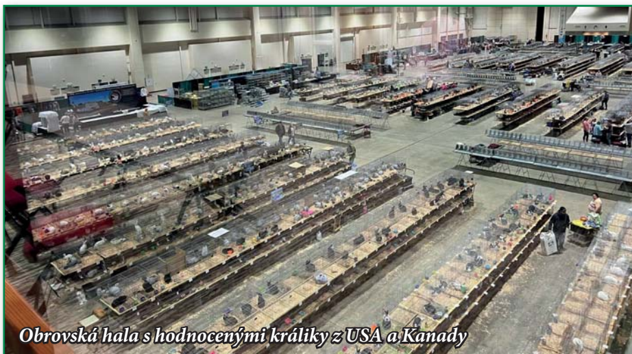
Obrovská hala s hodnocenými králíky z USA a Kanady

Málokdo to asi ví, ale tak jako jsou výstavy psů, mají svou více než stoletou tradici také výstavy čistokrevných plemen králíků. Nejedno z plemen pak označujeme jako naše národní. Jistě by vás napadlo třeba notoricky známý český strakáč. No, dalším do party by byli čeští černopesíkatí, které chovám od dětství. A právě u tohoto našeho plemene se mi podařilo nevídané. Před několika lety ke mně opakovaně zavítali chovatelé z USA a Kanady, abych následně letecky vyslal několik skupin těchto bílých králíků s tmavě hnědým okem do Ameriky.