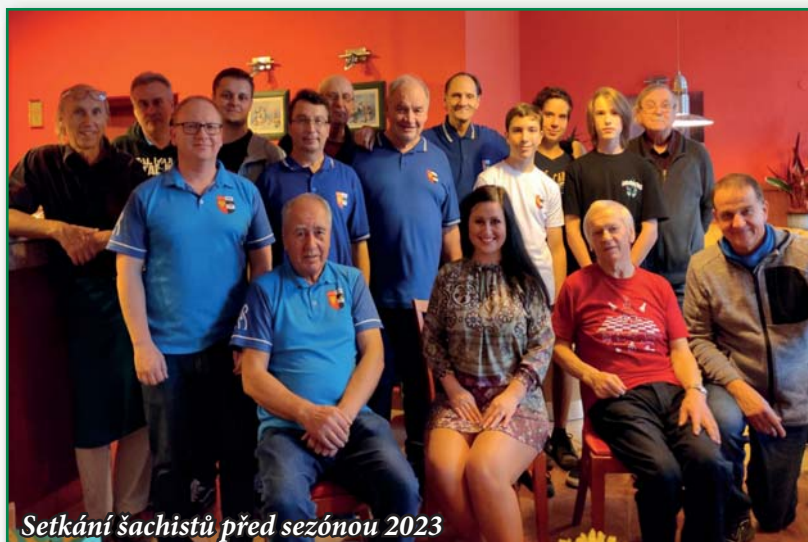
Setkání šachistů před sezónou 2023