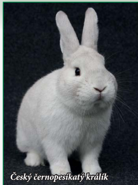
Český černopesíkatý králík