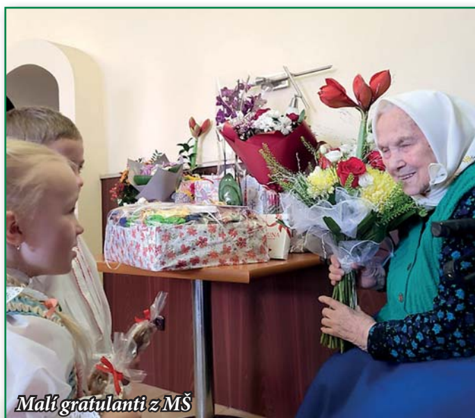
Malí gratulanti z MŠ