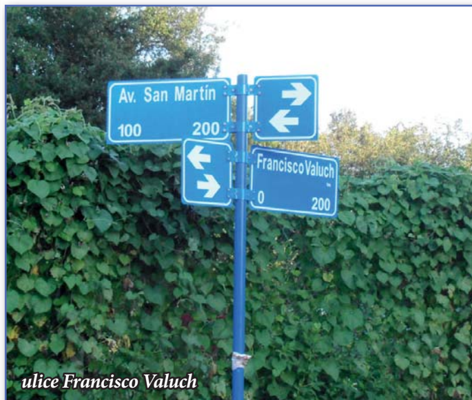
ulice Francisco Valuch