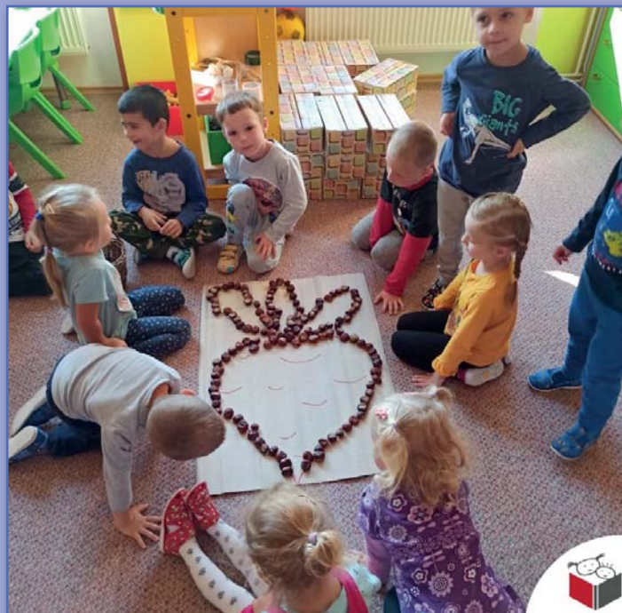
skládání obrázků z kaštanů

Prušánský zpravodaj 4/2021, vychází čtvrtletně, periodický tisk územního samosprávného celku.