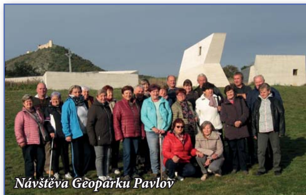
Návštěva Geořarku Pavlov