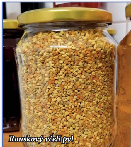
Rouskový včelí pyl