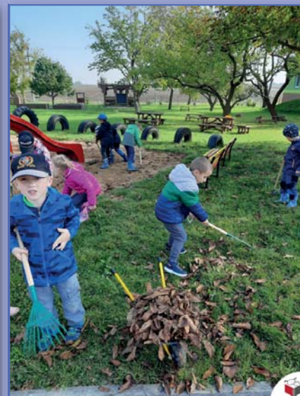
hrabeme listí na zahradě