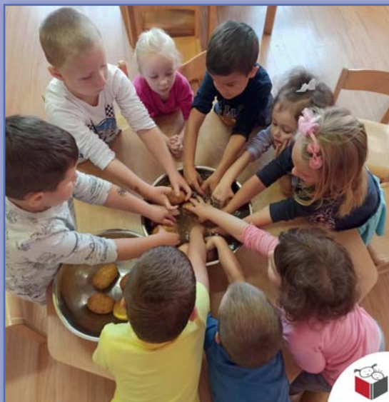
budeme péct brambory