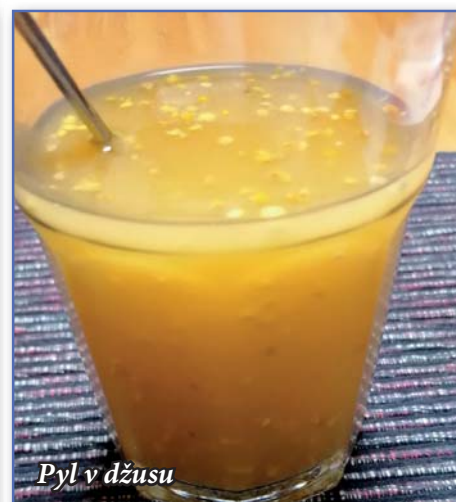
Pyl v džusu