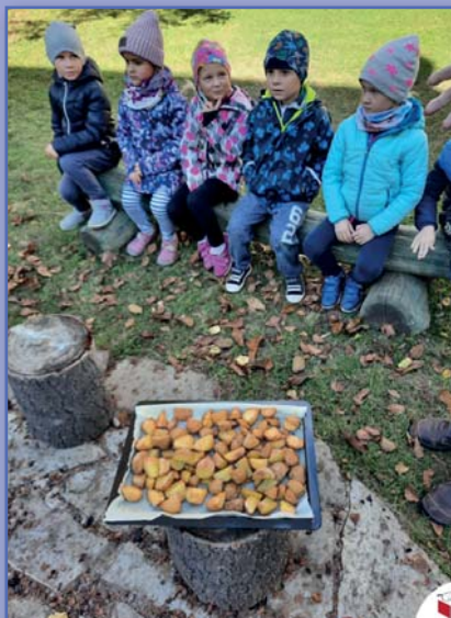
pečené brambory nám chutnají