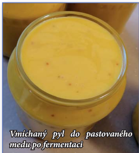
Vmíchaný pyl do pastovaného medu po fermentaci

Včelařství Tomáš Polách, Peckova 61, Čejkovice, foto archiv autora