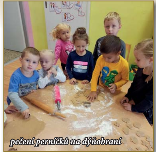
pečení perníčků na dýňo- brání