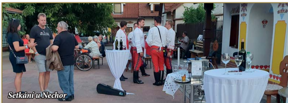
Setkání u Nechor