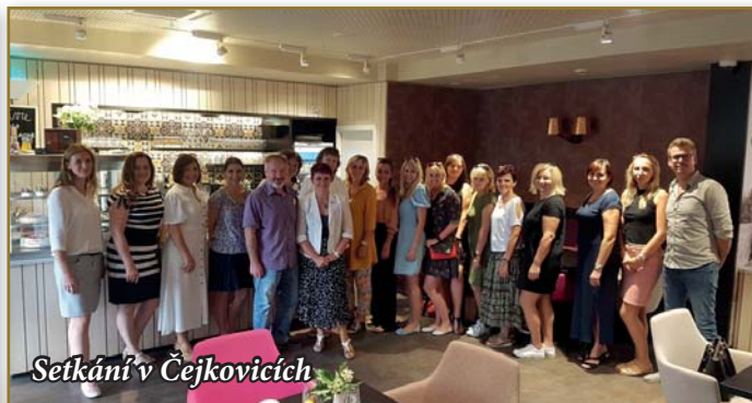
Setkání v Čejkovicích