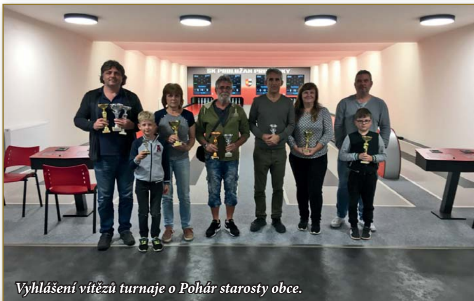
Vyhlášení vítězů turnaje o Pohár starosty obce.