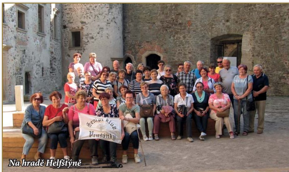
Na hradě Helfštýně

Za seniory Květa Kopečková