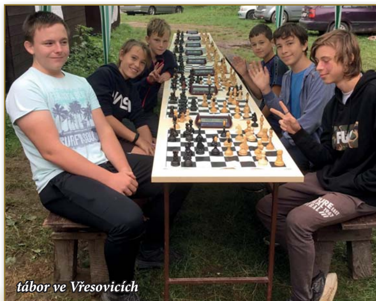
tábor ve Vřesovicích

V rámci šachové podpory a rozvoje mládeže v Prušánkách se stal šachový tábor Vřesovice v období letních prázdnin každoroční tradicí a vyhledávaným společensko-herním cílem dětí.