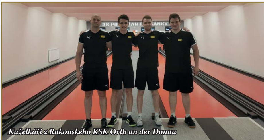
Kuželkáři z Rakouského KSK Orth an der Donau

Na přelomu července a srpna jsme uspořádali už tradiční 12. ročník Memorálu Stanislava Zálešáka, kdy k nám přijeli kuželkáři ze všech koutů naší republiky, protože turnaj byl zařazen jako kvalifikace pro mistrovství ČR dvojic. Byli jsem rádi, že si k nám znovu naši cestu kuželkáři z Rakouska a Slovenska i přes zpřísněné cestování přes hranice. Vítězem se nakonec stala dvojice hájící barvy prvoligového oddílu KK Vyškov