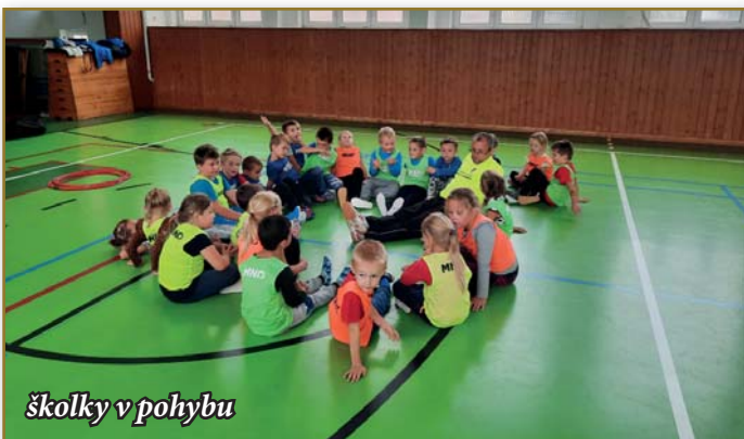
školky v pohybu