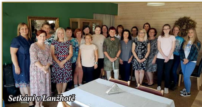
Setkání v Lanžhotě

Paní senátorka pozvala všechny tyto dobrovolníky na malá posezení u kávy, část lidí do Sonnentoru v Čejkovicích a část do Lanžhota, kde jim osobně poděkovala a předala malé dárečky.