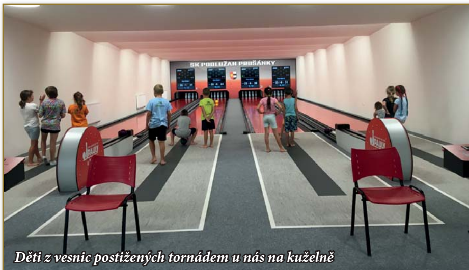
Děti z vesnic postižených tornádem u nás na kuželně