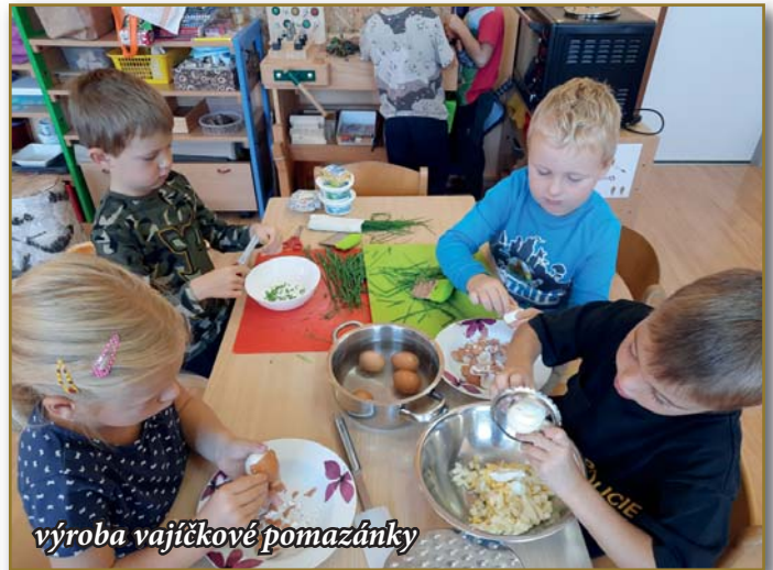
výroba vajíčkové pomazánky