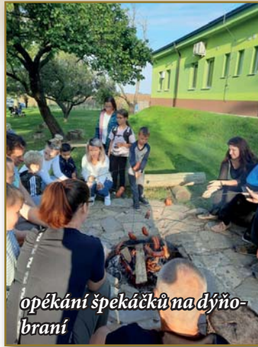
opékání špekáčků na dýňo- brání