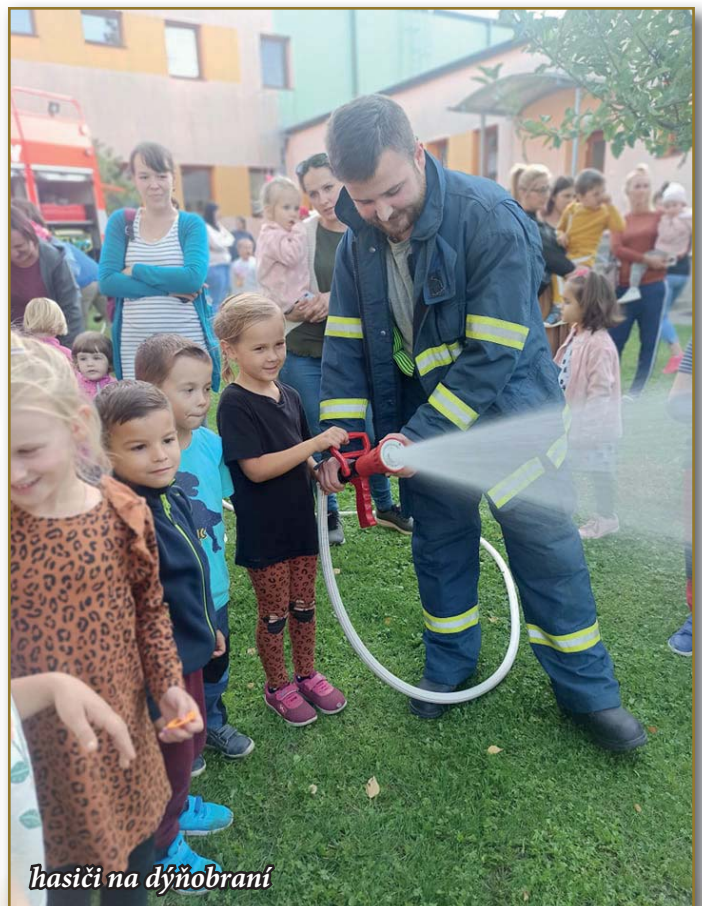
hasiči na dýňo- brání