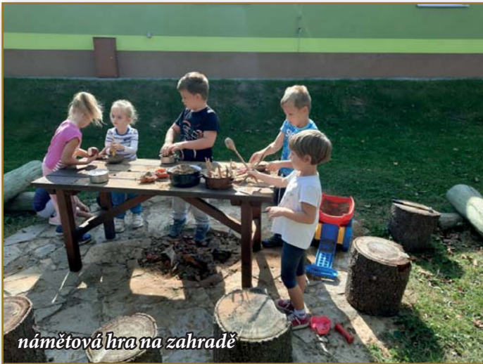
námětová hra na zahradě