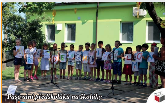
Pasování předškoláků na školáky