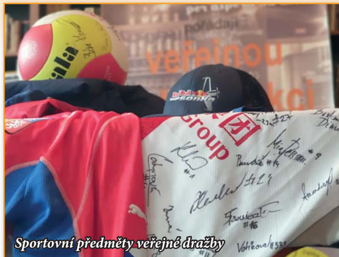
Sportovní předměty veřejně dražby