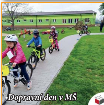
Dopravní den v MŠ