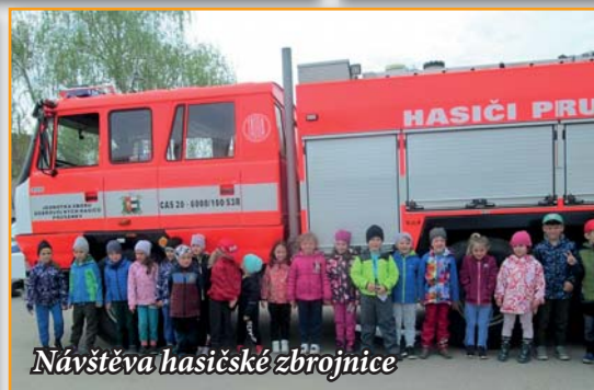
Návštěva hasičské zbrojnice