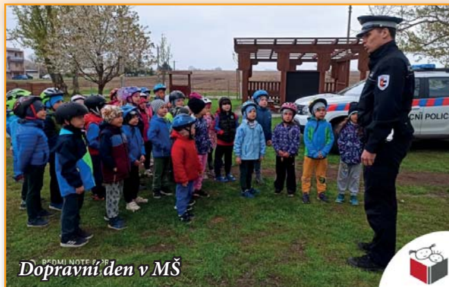
Dopravní den v MŠ