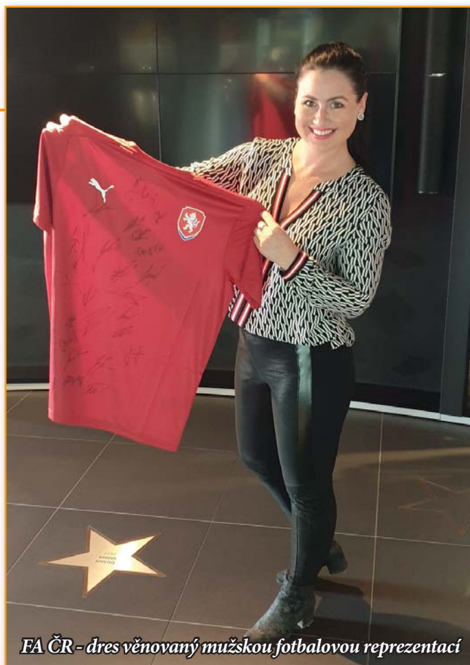
FA ČR - dres věnovaný mužskou fotbalovou reprezentací

Aukci podpořili také dresy současných fotbalistů Ond-