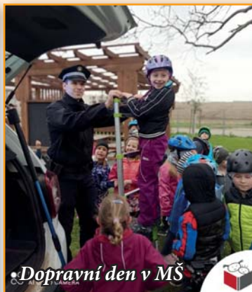
Dopravní den v MŠ