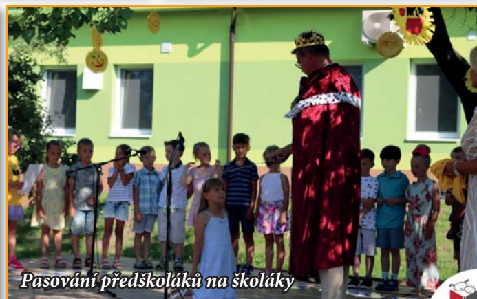
Pasování předškoláků na školáky