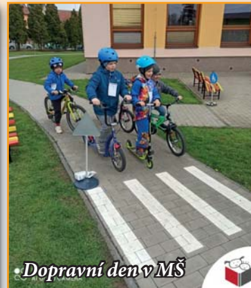
Dopravní den v MŠ