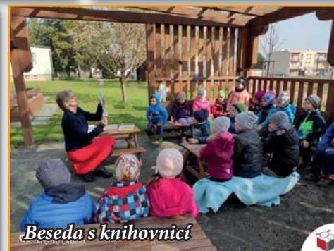
Beseda s knihovnicí