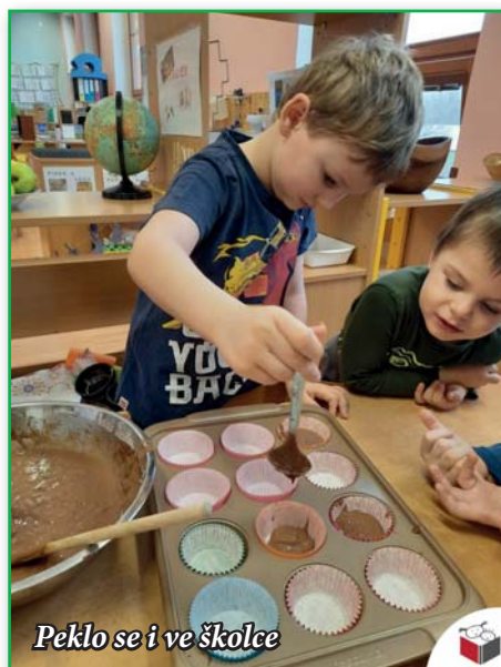
Peklo se i ve školce