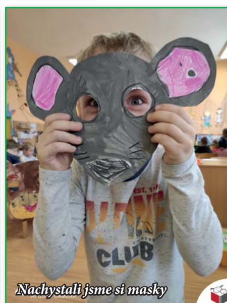
Nachystali jsme si masky