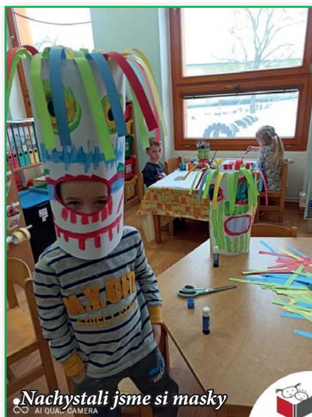
Nachystali jsme si masky