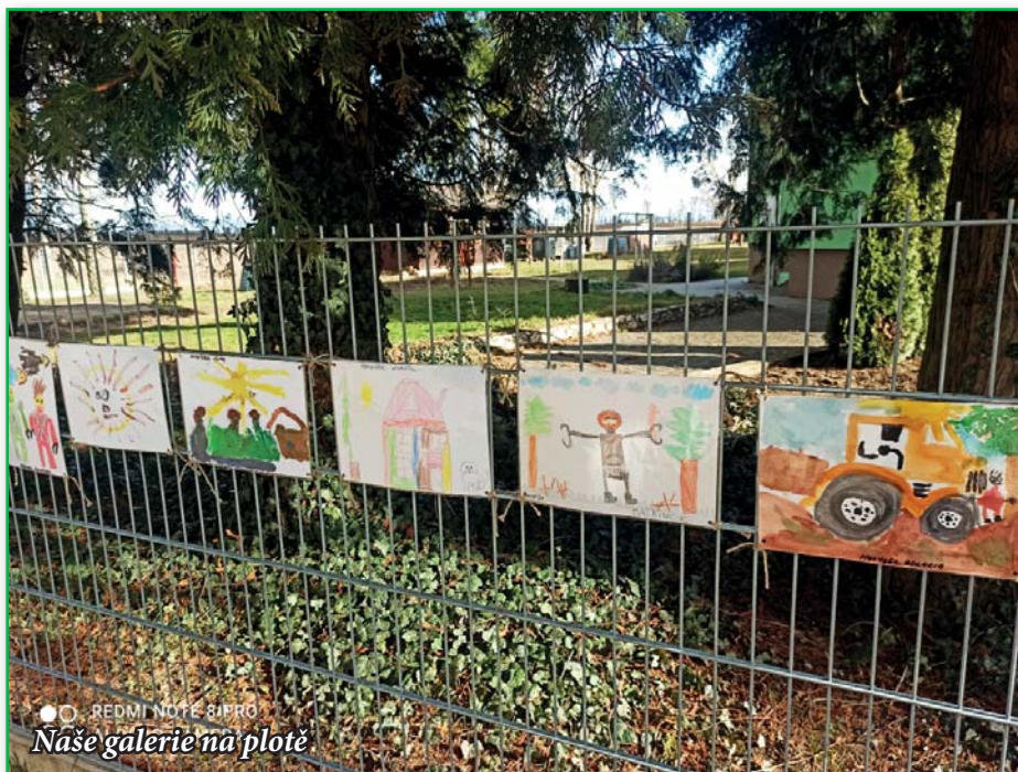
REDMI NOTE 8IPRO Naše galerie na plotě