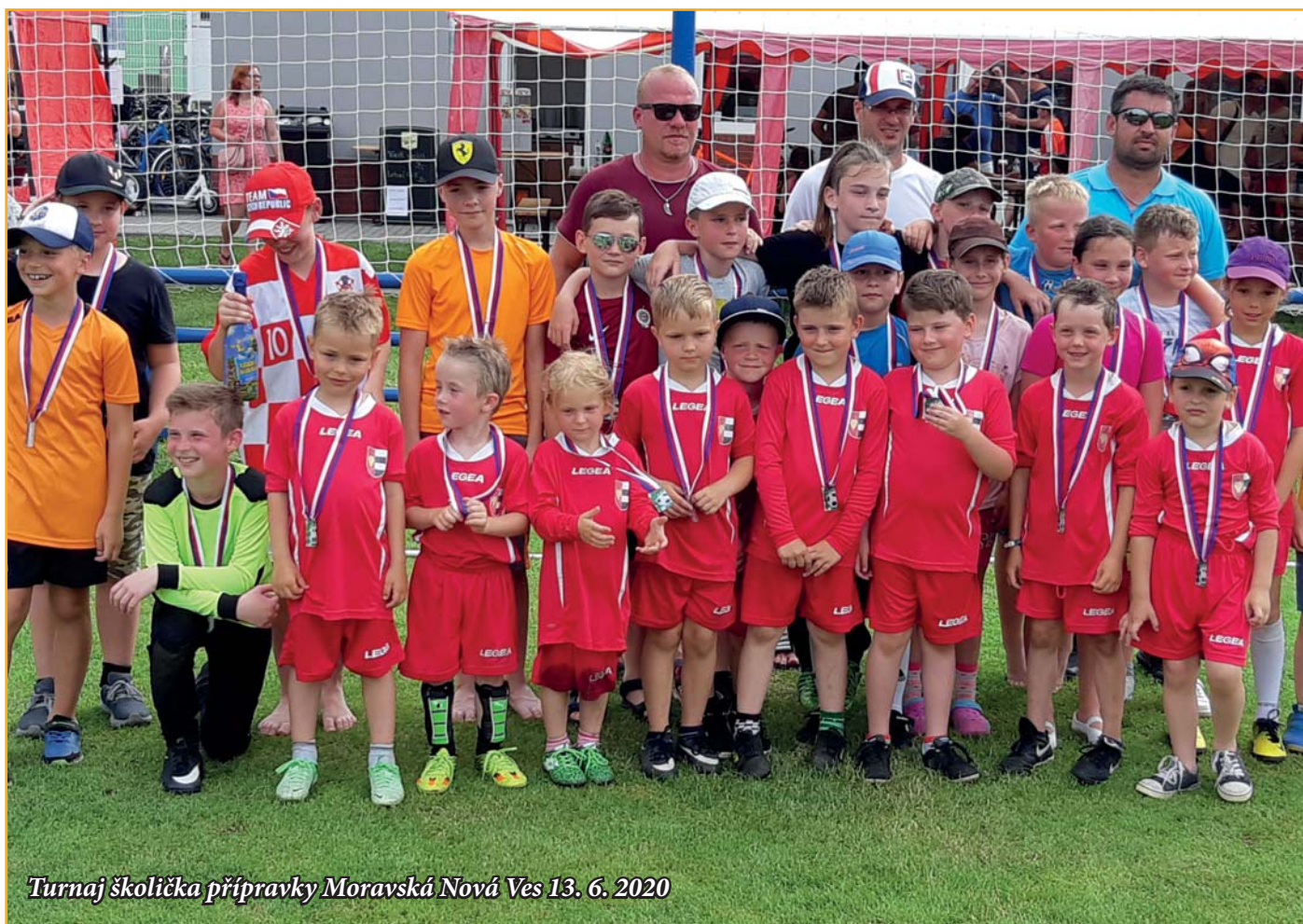
Turnaj školička přípravky Moravská Nová Ves 13. 6. 2020