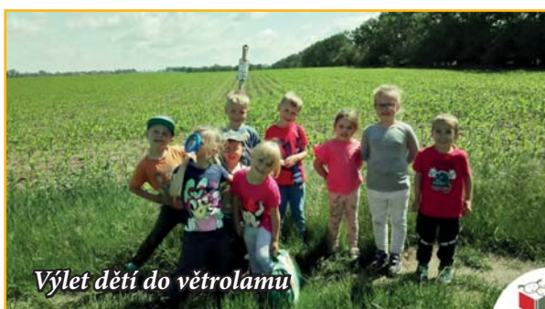
Výlet dětí do větrolamu