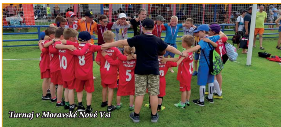
Turnaj v Moravské Nové Vsi