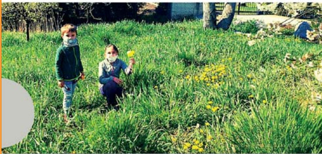
A ZASE SUCHO - DÍL 2.