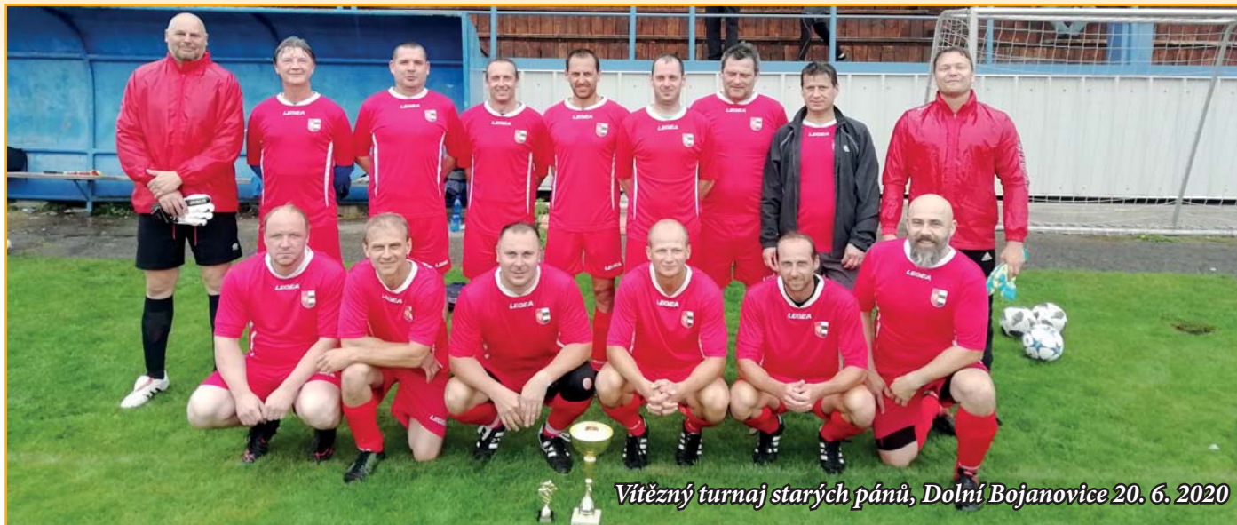
Vítězný turnaj starých pánů, Dolní Bojanovice 20. 6. 2020