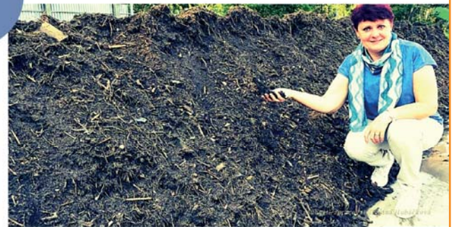
A ZASE SUCHO - DÍL 3.

Vy, co už bazén máte, prosím pečujte o něj, vodu vyměňujte minimálně, nevypouštějte ji do kanalizace, zkuste ji třeba znovu využít.