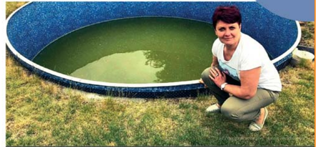
A ZASE SUCHO - DÍL 1.