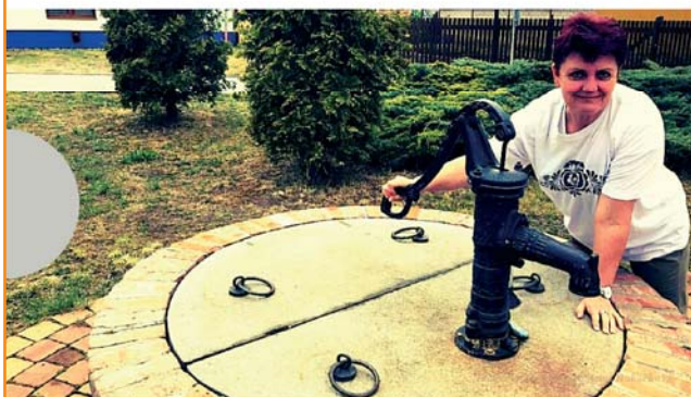
A ZASE SUCHO - DÍL 5.