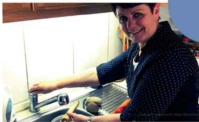
A ZASE SUCHO - DÍL 4.