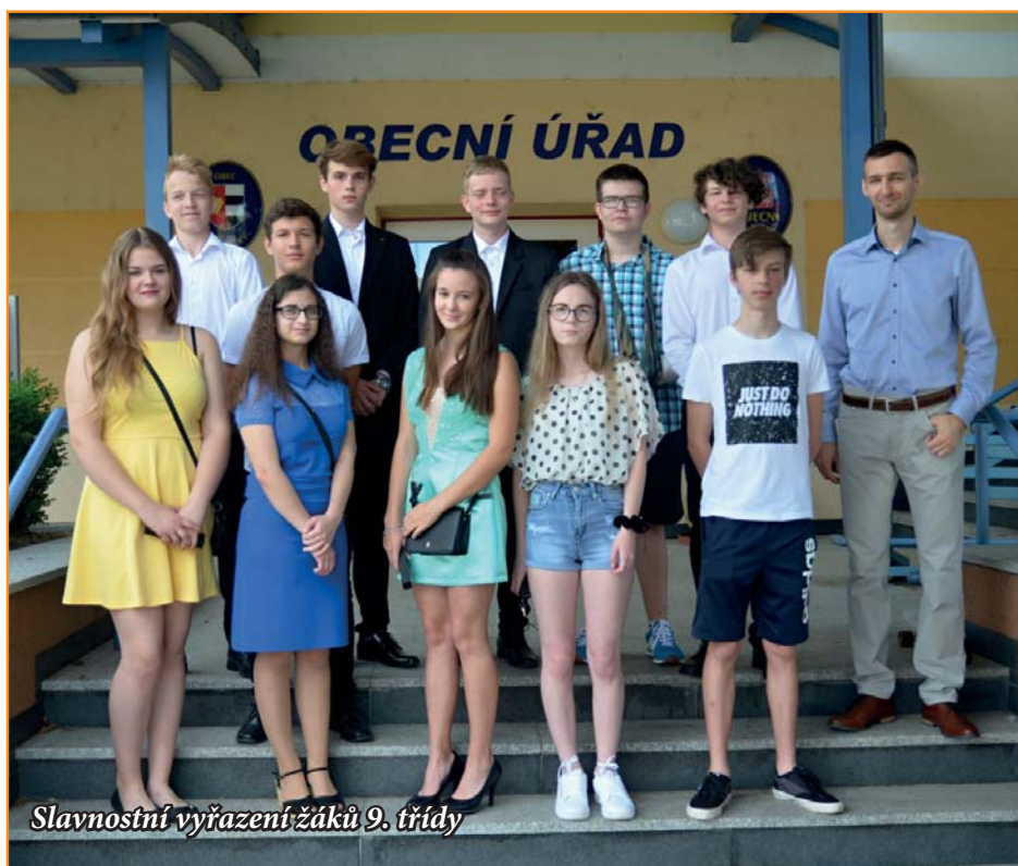
Slavnostní vyřazení žáků 9. třídy