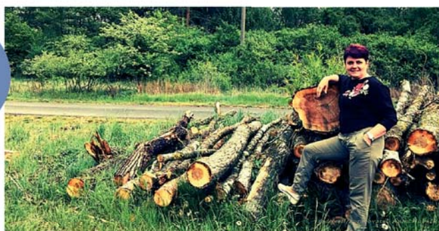
A ZASE SUCHO - DÍL 6.