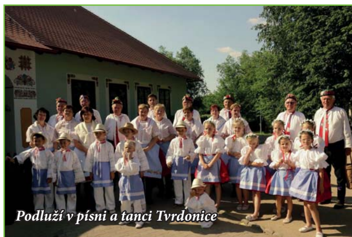
Podluží v písni a tanci Tvrdonice