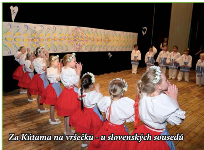
Za Kútama na vršečkü - u slovenských susedü