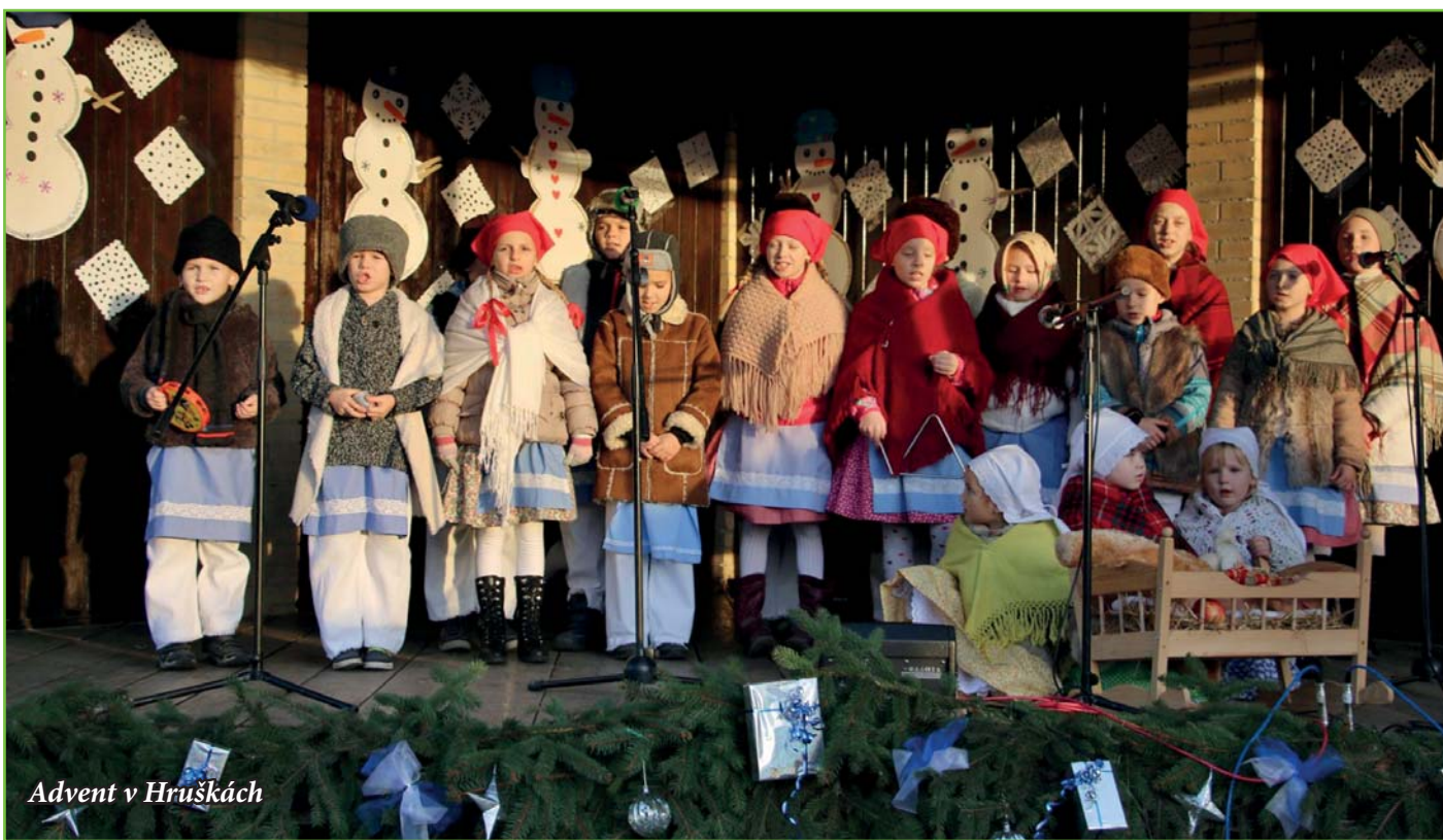
Advent v Hruškách