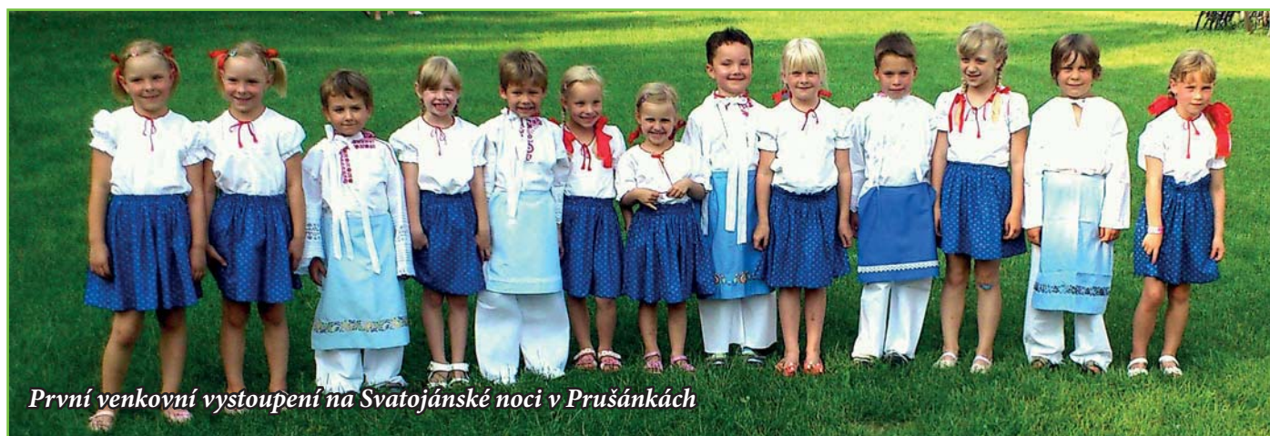
První venkovní vystoupení na Svatojánské noci v Průšánkách