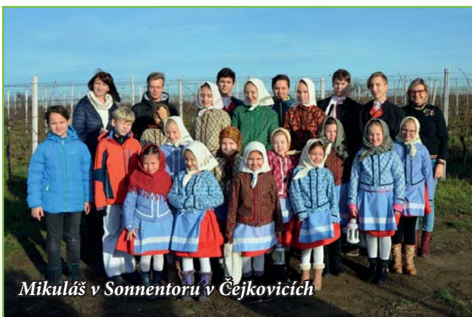
Mikuláš v Sonnentoru v Čejkovicích