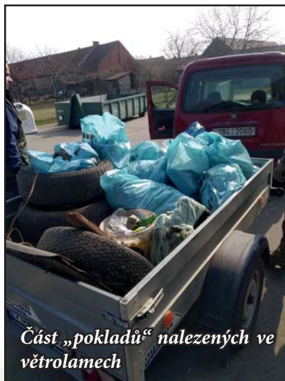
Část „pokladů“ nalezených ve větrolamech

Na podzim jsme také provedli dva menší hony na drobnou zvěř, zaměřené především na regulaci stavu zajíců ve vinicích a omezení škod.