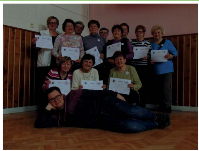
Absolventky kurzu Zlepšování paměti