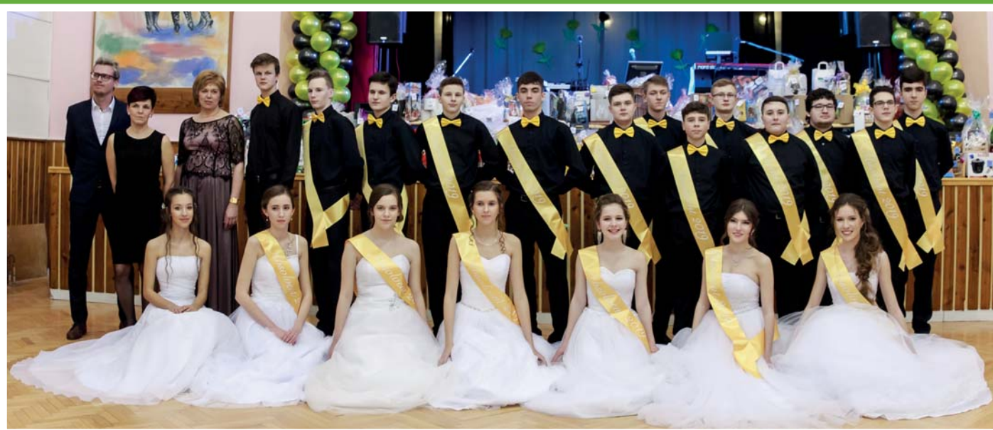
Společenský ples SRPDŠ

Prušánský zpravodaj 1/2019, vychází čtvrtletně, periodický tisk územního samosprávného celku. Vydavatel: Obec Prušánky, Prušánky 100, IČ 285226, DIČ CZ00285226. Šéfredaktor: PaedDr. Jana Kamenská. Redakce si vyhrazuje právo úpravy či krácení textů. Místo vydání: Prušánky. Evidenční číslo: MK ČR E 12423. Náklad 820 kusů. Grafická úprava a tisk: Tiskárna Brázda, www.TiskarnaBrazda.cz. Vyšlo 4. 4. 2018. Uzávěrka Zpravodaje č. 2/2019 bude 24. 6. 2019.