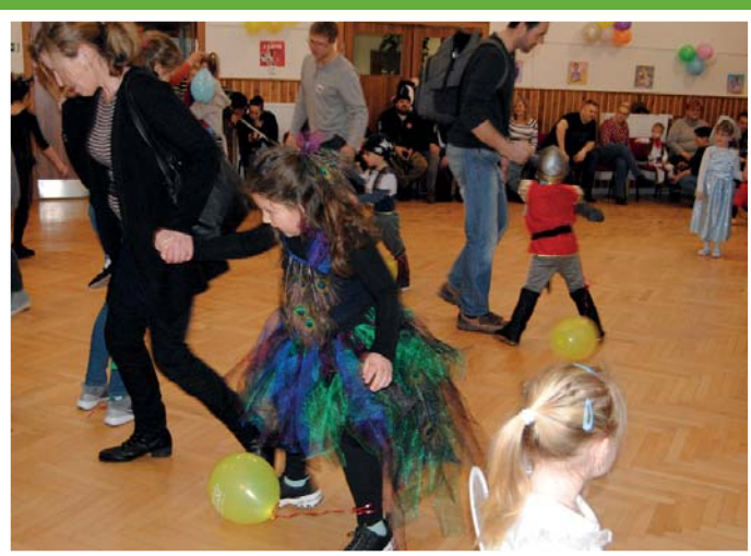
Na dětském karnevalu bylo veselo