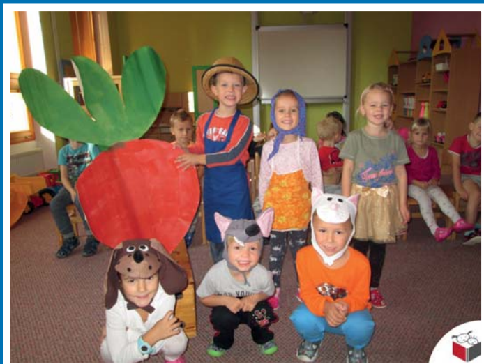
MŠ - Pohádka o veliké řepě