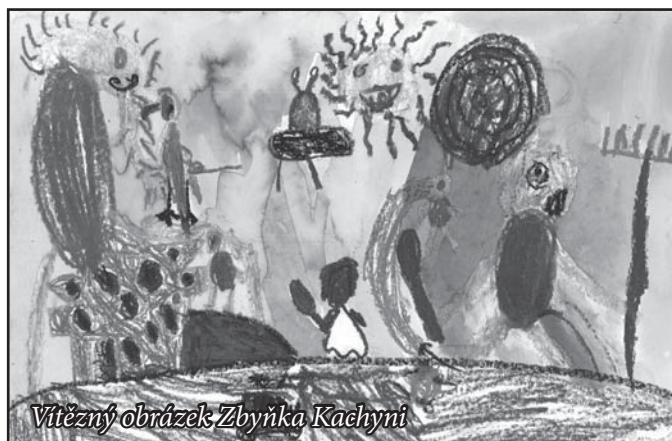
Vítězný obrázek Zbyňka Kachyni