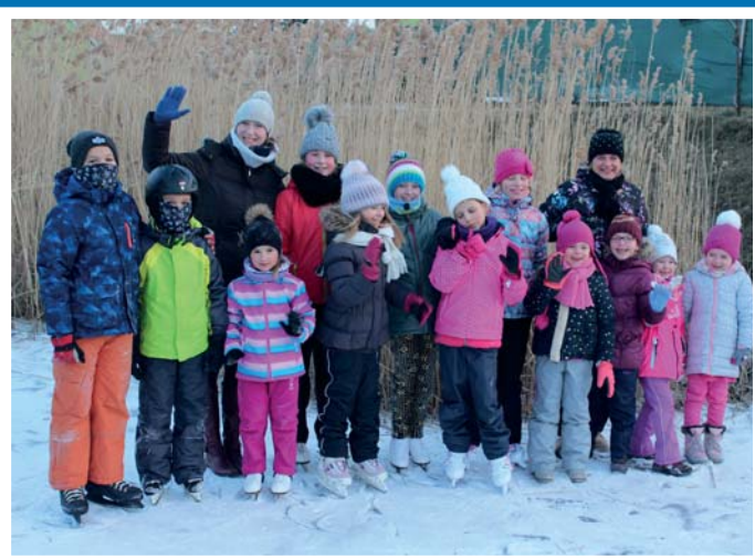
...a na společném bruslení