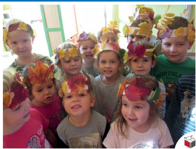
Podzim v MŠ