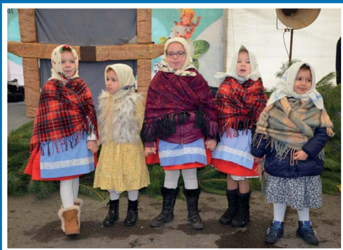
Nechoránek v Sonnentoru...