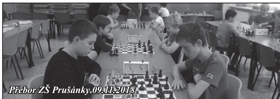
Přebor ZŠ Prušánky 09.11.2018