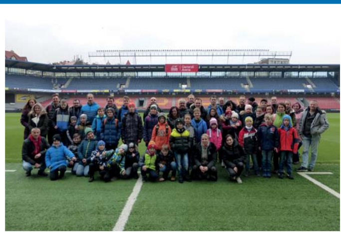
Na stadionu AC Sparta Praha

Prušánský zpravodaj 4/2018, vychází čtvrtletně, periodický tisk územního samosprávného celku. Vydavatel: Obec Prušánky, Prušánky 100, IČ 285226, DIČ CZ00285226. Šéfredaktor: PaedDr. Jana Kamenská. Redakce si vyhrazuje právo úpravy či krácení textů. Místo vydání: Prušánky. Evidenční číslo: MK ČR E 12423. Náklad 820 kusů. Grafická úprava a tisk: Tiskárna Brázda, www.TiskarnaBrazda.cz. Vyšlo 10. 12. 2018. Uzávěrka Zpravodaje č.4/2018 bude 25. 3. 2018.