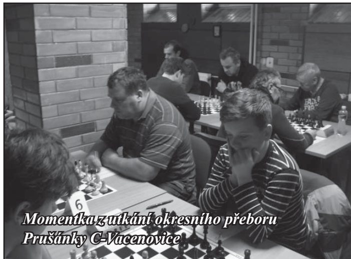
Momentka z utkání okresního přeboru Prušánky C-Vacenovice