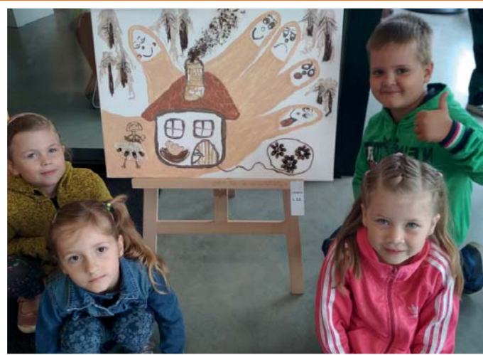
Malí umělci ze školky