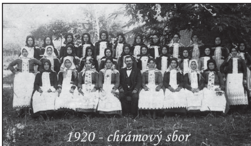
1920 - chrámový sbor