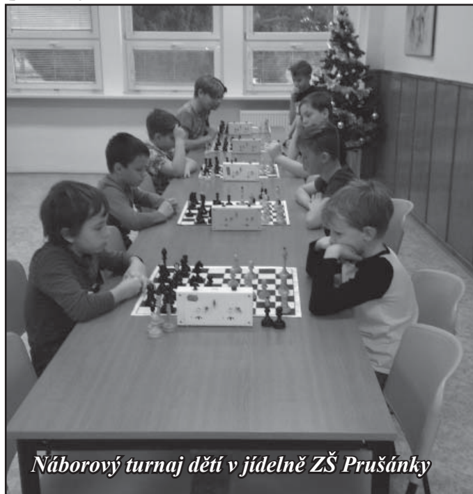
Náborový turnaj dětí v jídelně ZŠ Prušánky