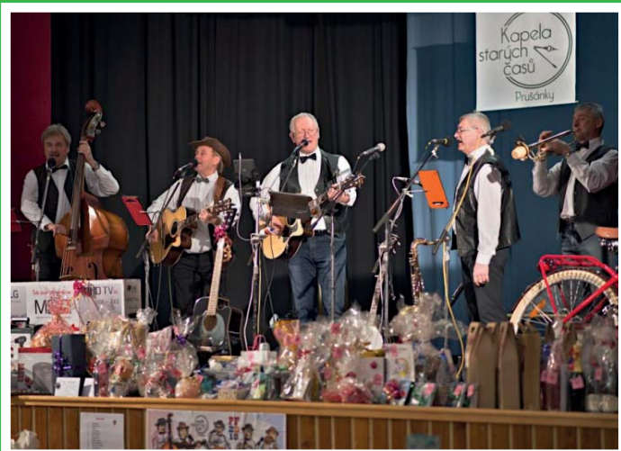
Čundrbál Kapely starých časů