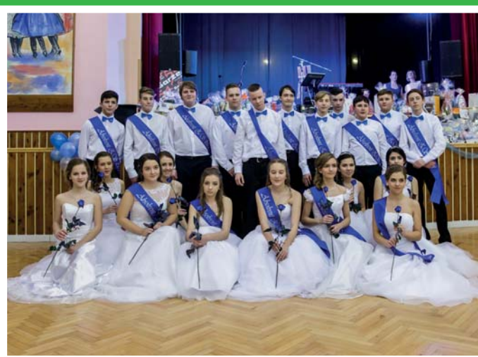
Ples SRPDŠ