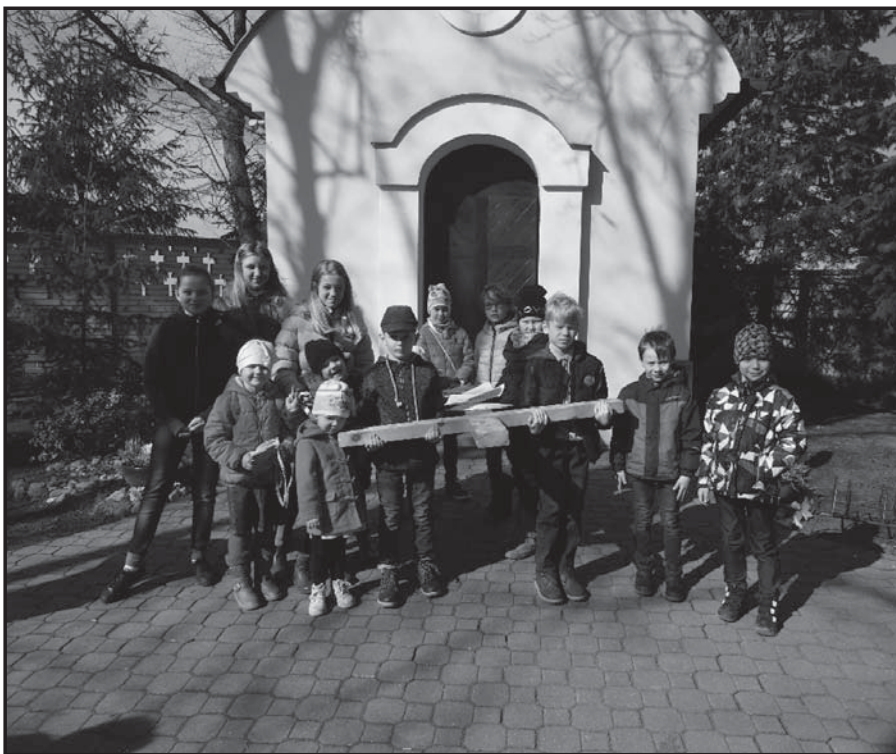
Hra Putování po křížích