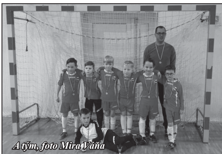
A tým