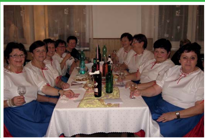
Seniorky na návštěvě v Prietržke