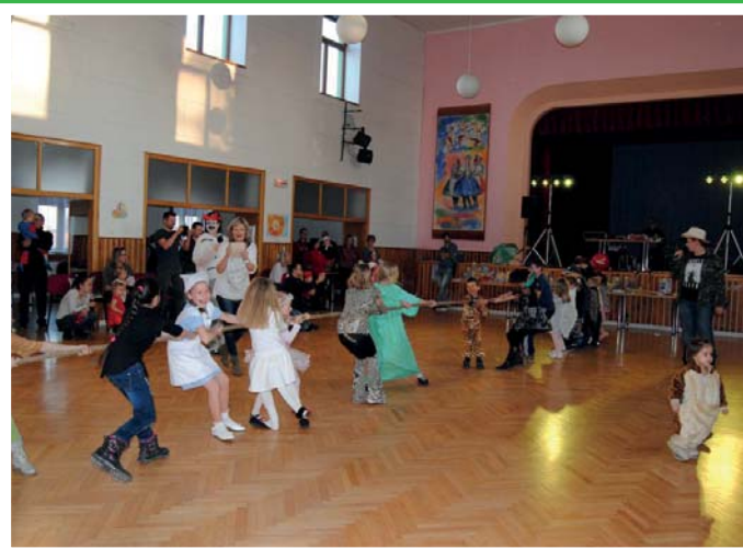
Dětský karneval