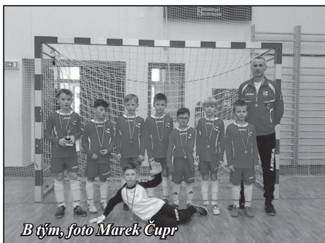
B tým, foto Marek Čupr