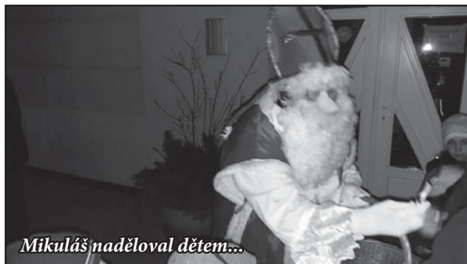
Mikuláš naděloval dětem...