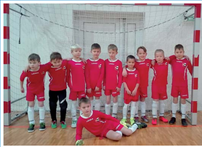
Mladší příprava na turnaji OHL v Lužicích