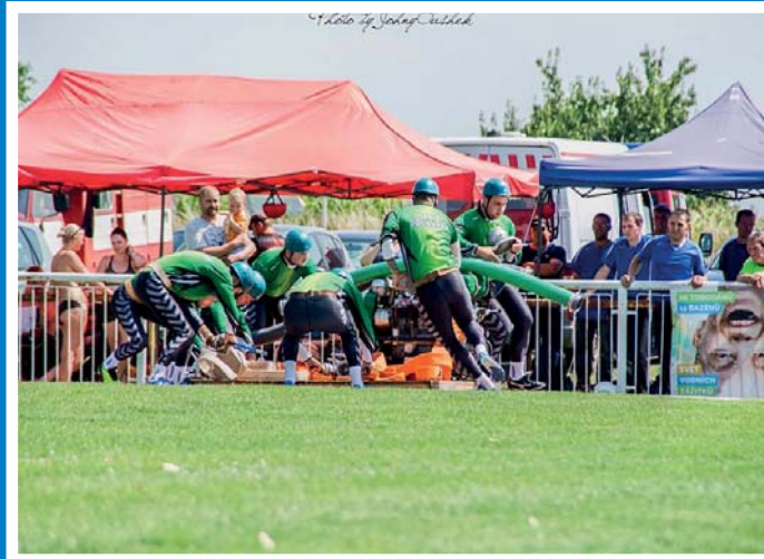
SDH Prušánky na soutěži