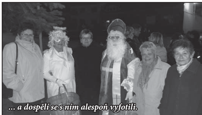
... a dospělí se s ním alespoň vyfotili.