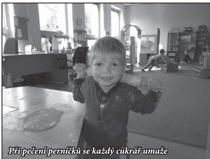
Při pečení perníčků se každý cukrář umaže