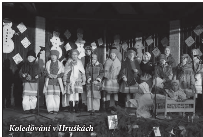
Koledování v Hruškách