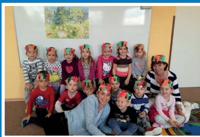
Vzpomínka na podzim