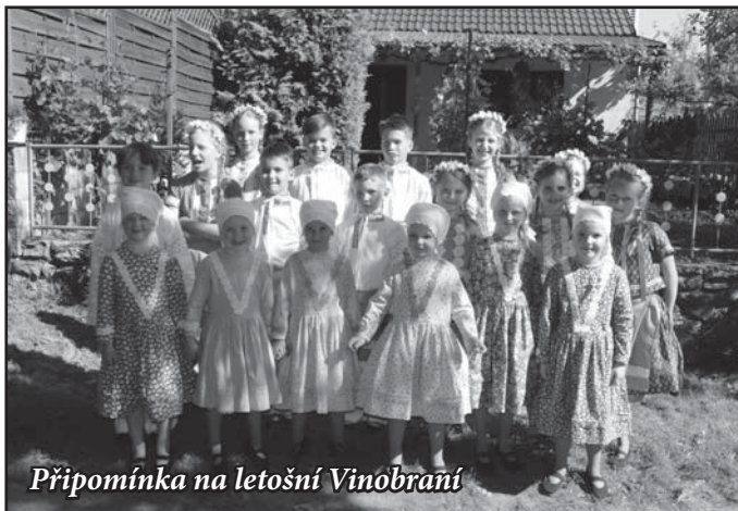
Připomínka na letošní Vinobraní