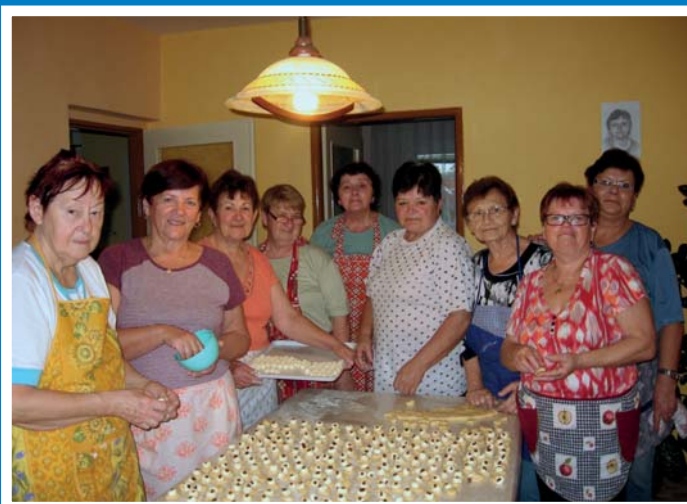
Seniorky pečou koláče na Martinské posezení