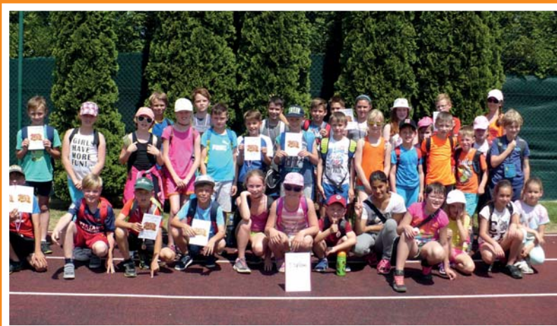
Sportovci I. stupně na Atletických přeborech Podluží