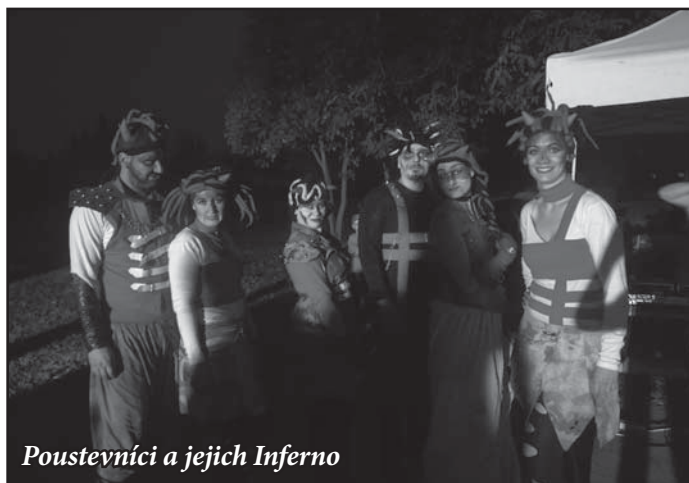
Poustevníci a jejich Inferno