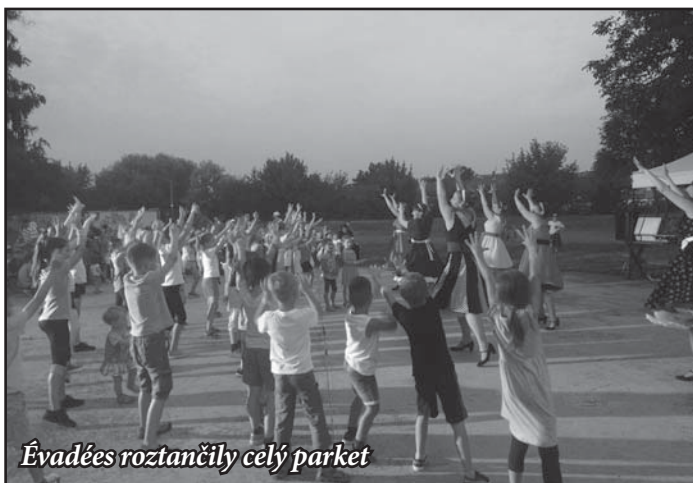
Évadées roztančily celý parket