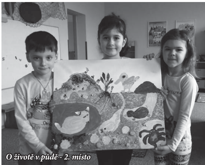
O životě v půdě - 2. místo