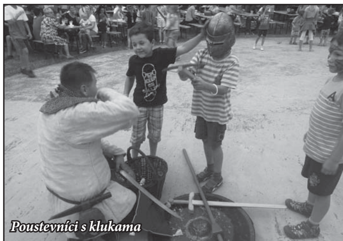
Poustevníci s klukama