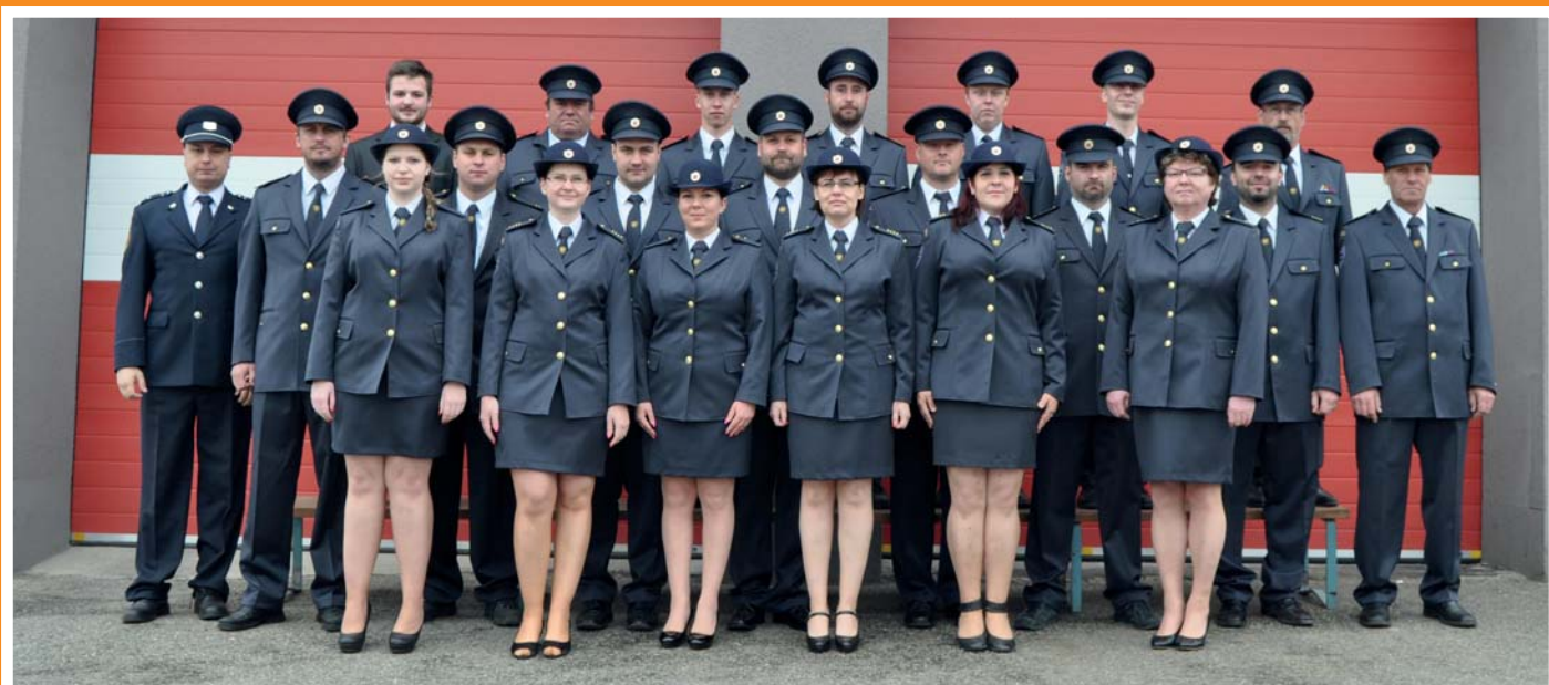
Členská základna SDH Průšanky