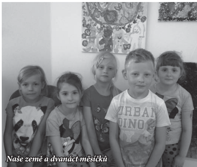
Náše země a dvanáct měsíčků