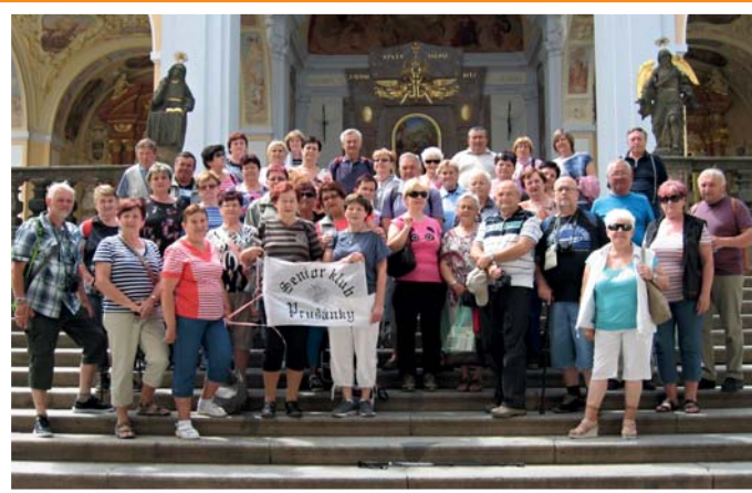
Naši senioři na Svaté Hoře u Příbrami