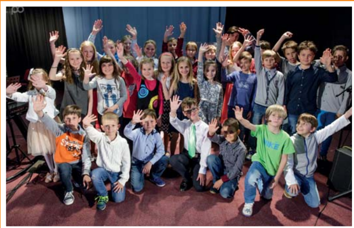
Besídka HTVŠ ke Dni matek - účinkující děti