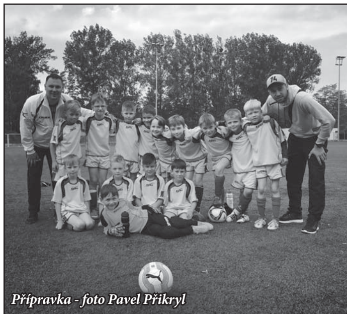
Přípravka