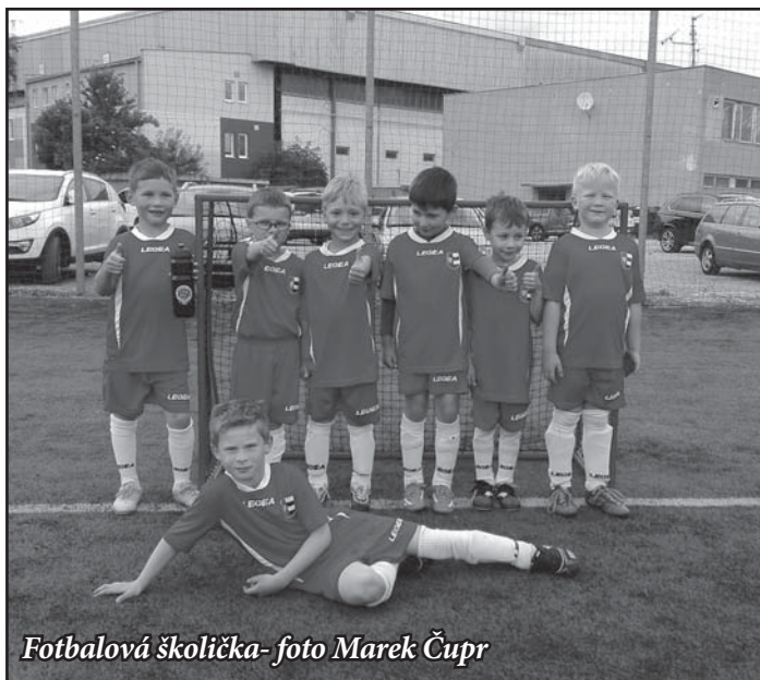
Fotbalová školička