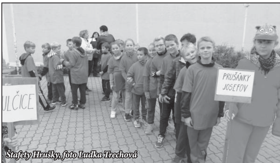
Štafety Hrušky

Návštěva Planetária v Brně a pavilonu Anthropolu proběhla 24. 11. a byla určena pro 5. a 6. třídu. V posledním týdnu byla možnost podívat se k prvňáčkům v rámci „Dne otevřených