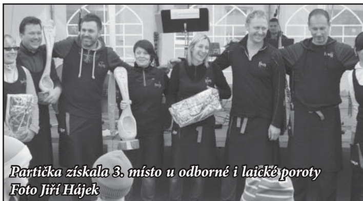
Partička získala 3. místo u odborné i laické poroty