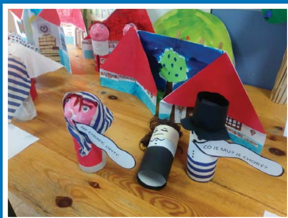
Práce předškoláků - Vysvětlení názvu Nechory