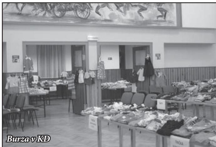
Burza v KD