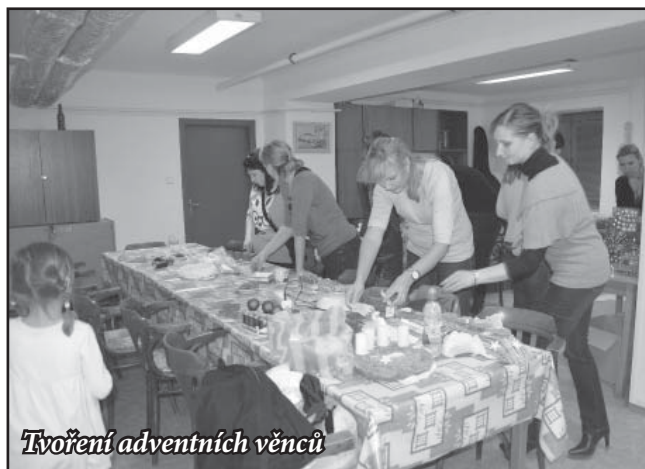
Tvoření adventních věnců