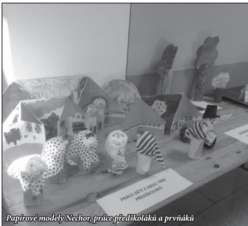
Papírové modely Nechor, práce předškoláků a prvňáčků