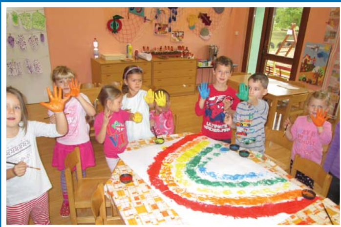
Duha a děti z MŠ