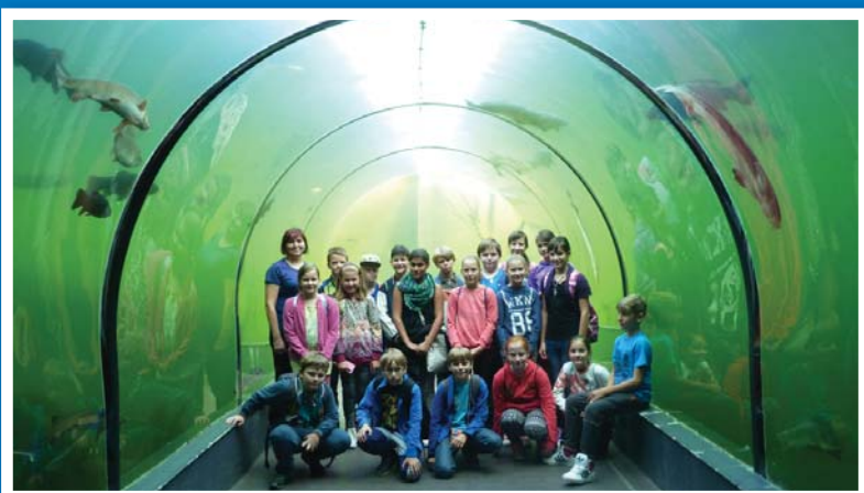
Pátáci ve sladkovodním tunelu v Modré