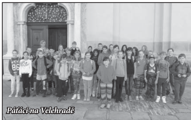
Pátáci na Velehradě