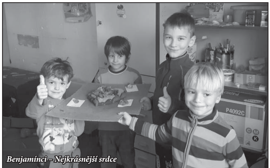
Benjamínci – Nejkrásnější srdce