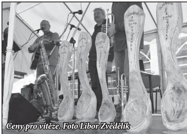
Ceny pro vítěze.

Už teď se všichni těšíme na další ročník ☺