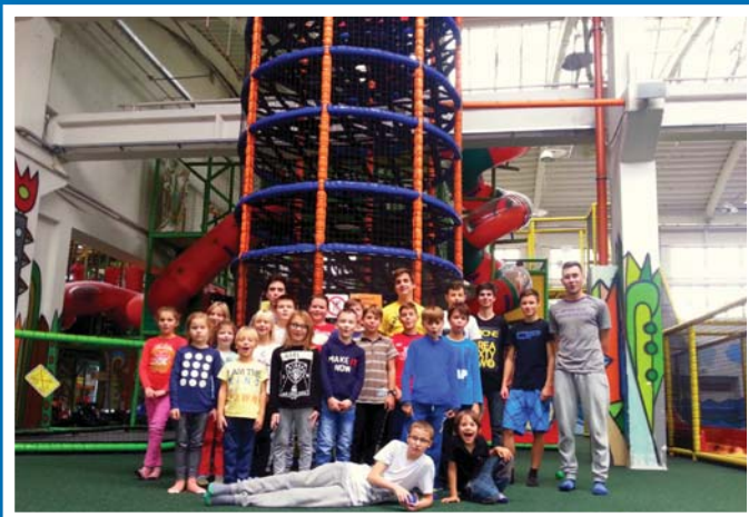
Výprava skautů do Bonga