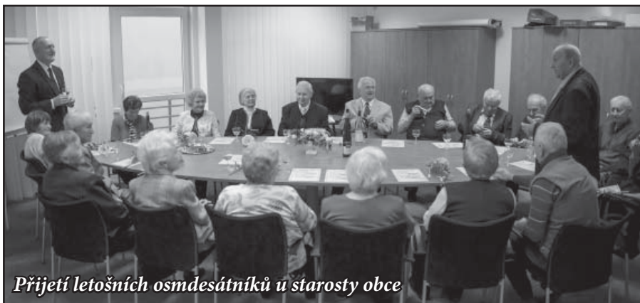
Přijetí letošních osmdesátníků u starosty obce