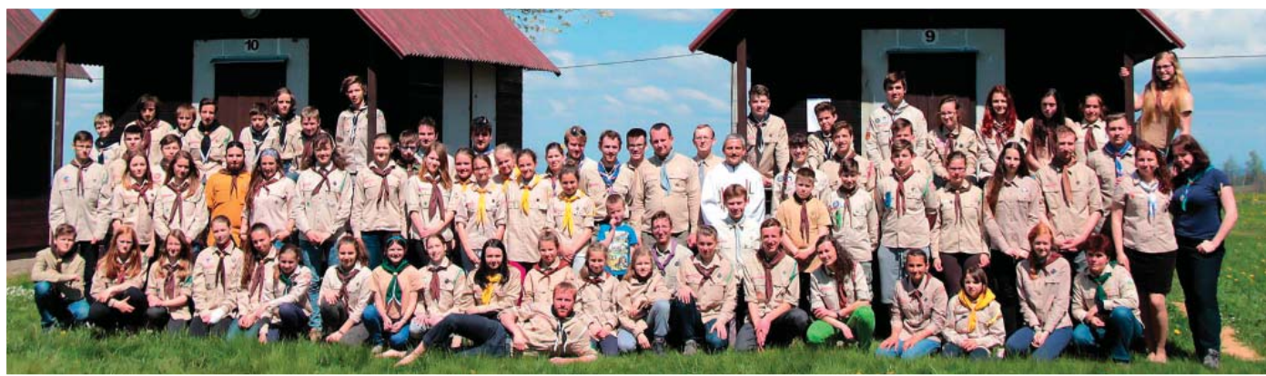
Celostátní setkání křesťanských oddílů Čachnov