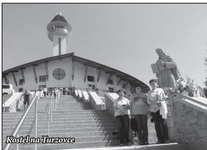
Kostel na Turzovce

Protože nám počasí opravdu přálo, ve středu jsme jeli na