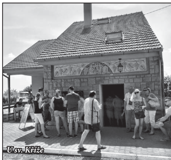
U sv. Kříže