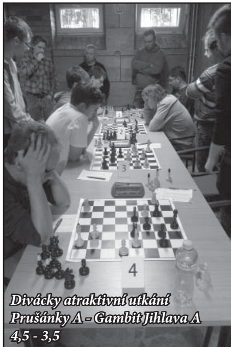
Divácky atraktivní utkání Prušánky A - Gambit Jihlava A 4,5 - 3,5