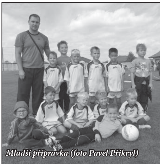
Mladší přípravka