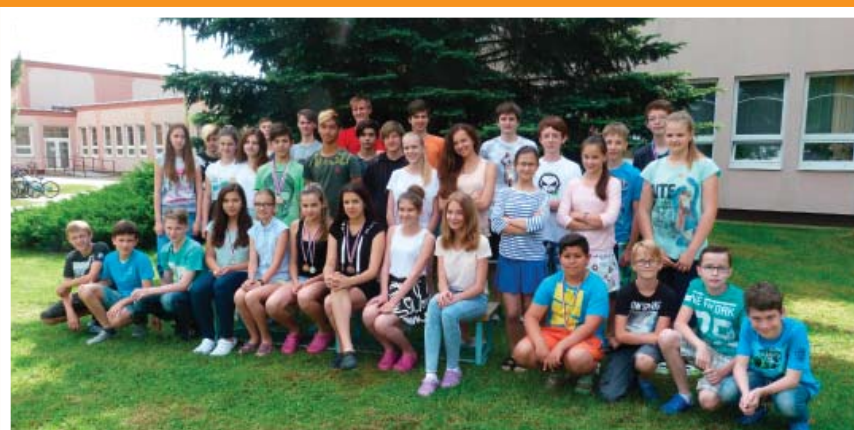
Nejlepší sportovci ze ZŠ