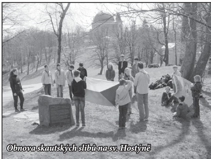
Obnova skautských slibů na sv. Hostýně

Za vedení oddílu Libor Sukup