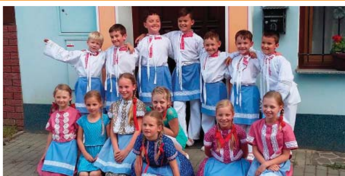
Májové zpívání