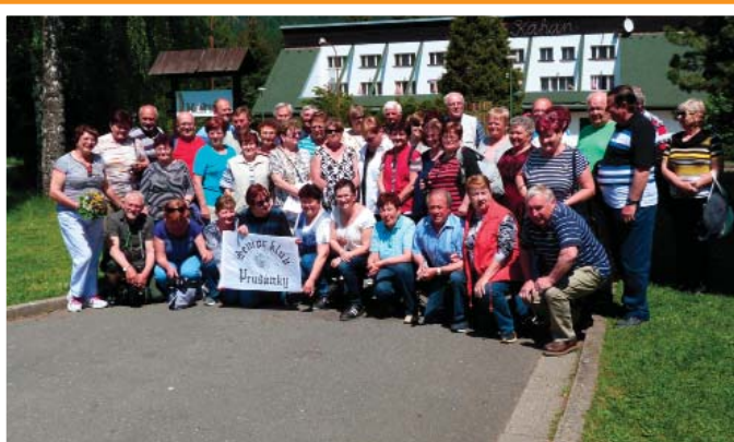
Seniři v Luhačovicích