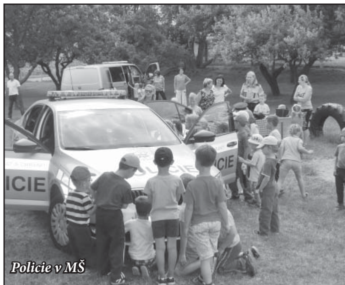
Policie v MŠ

text a foto Radka Šůrková vedoucí učitelka