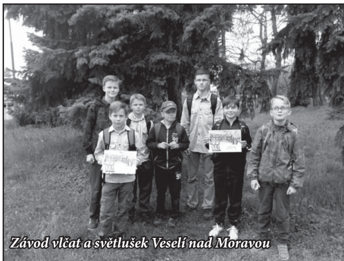
Závod vlčat a světlušek Veselí nad Moravou