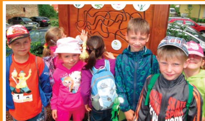
Školčátka na výletě