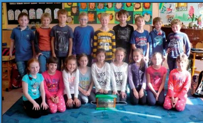
Třetáci a domácí mraveniště