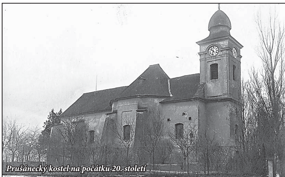
Prušánecký kostel na počátku 20. století