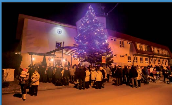
Rozsvícení vánočního stroměčku