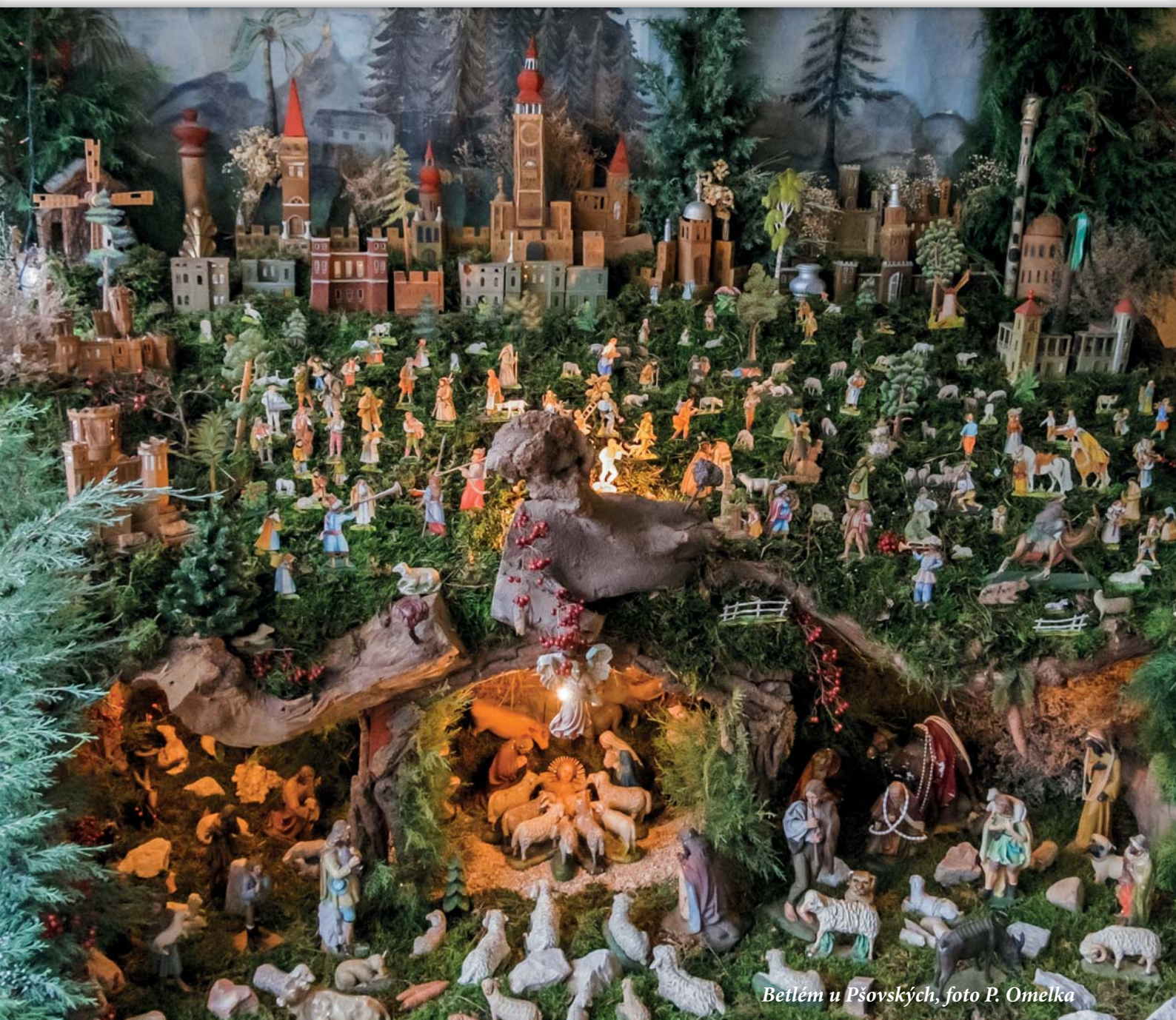
Betlém u Pšovských

Přejeme vám, milí spoluobčané, pohodové svátky vánoční prožité s vašimi nejbližšími a v novém roce hodně zdraví, lásky, spokojenosti a splnění všech vašich přání.