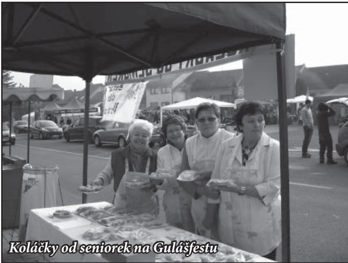
Koláčky od seniorek na Gulášfestu