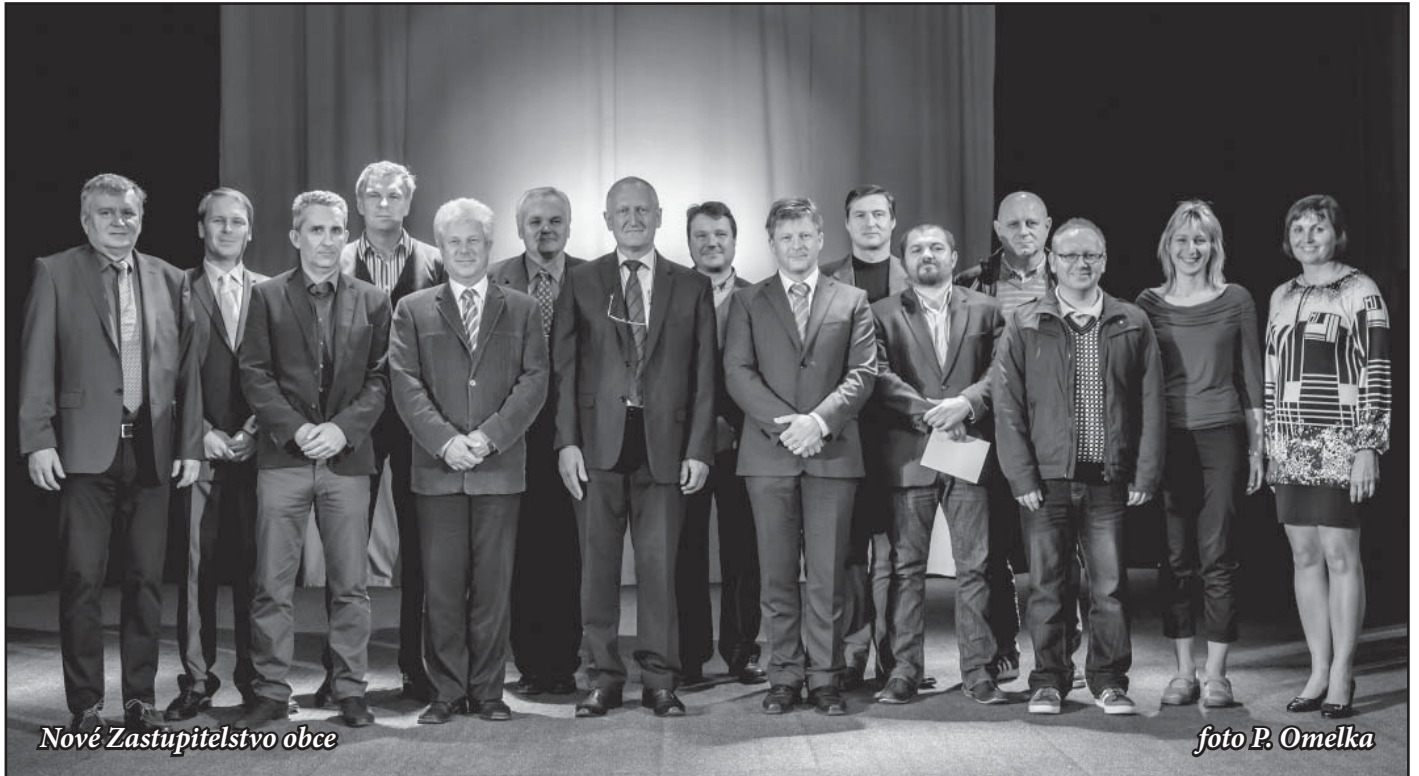
Nové Zastupitelstvo obce