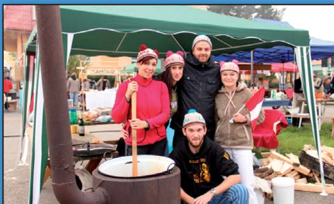
Vítězný tým III. Gulášfestu - Lamy