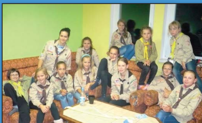
Skauti z Cor Dare