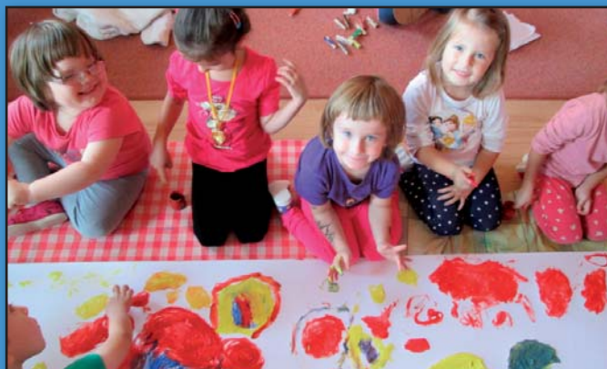
Pohádka a děti z MŠ