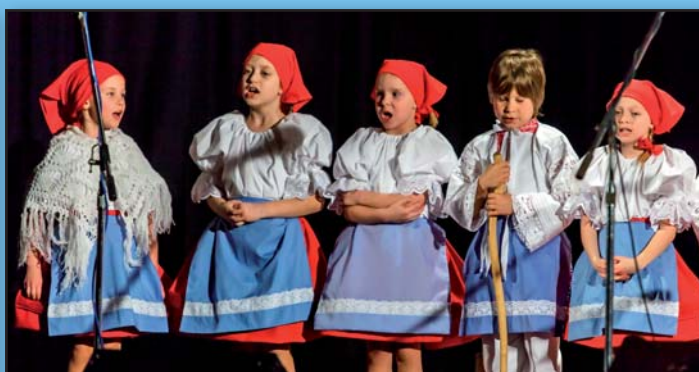
Vánoční koncert