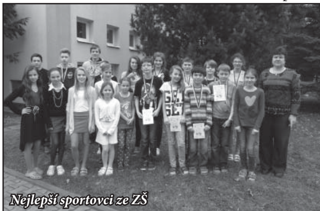
Nejlepší sportovci ze ZŠ