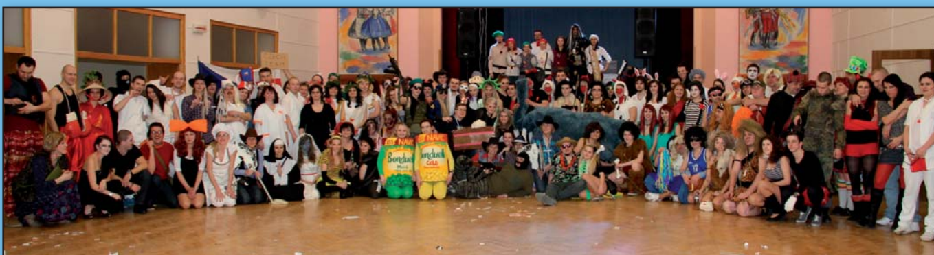
Maškarní bál