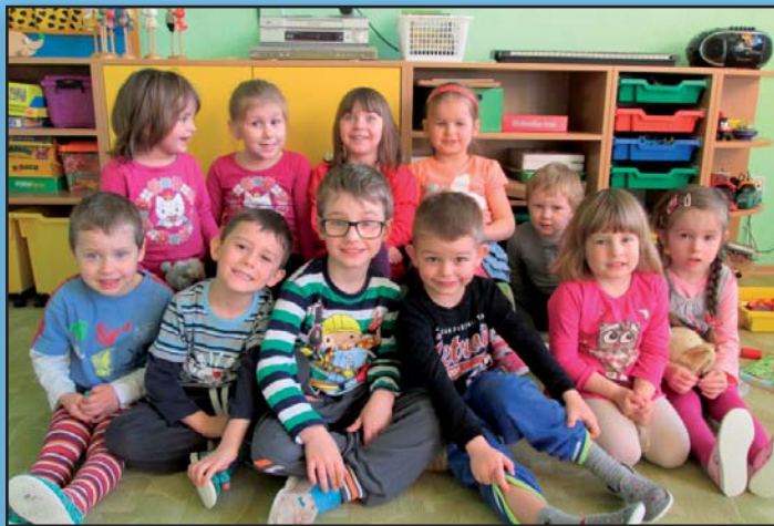
Dětičky ze školčky