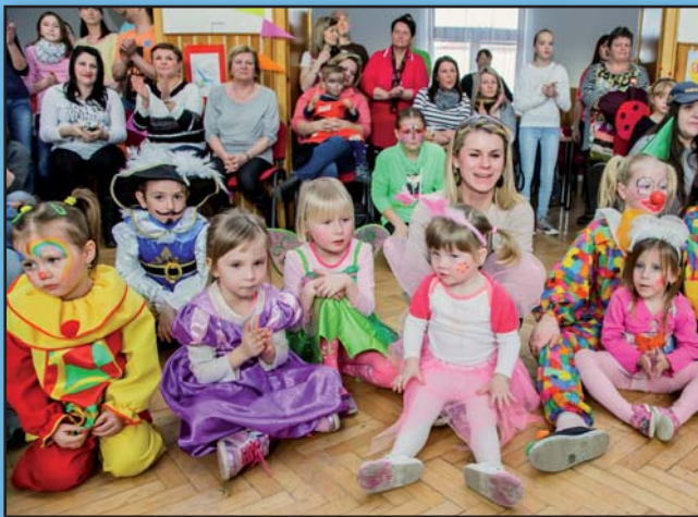
Dětský karneval