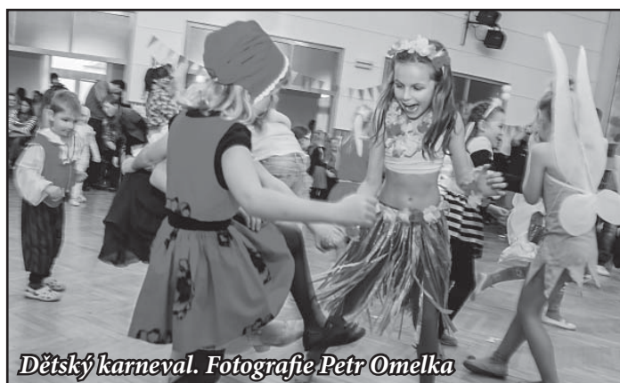
Dětský karneval.