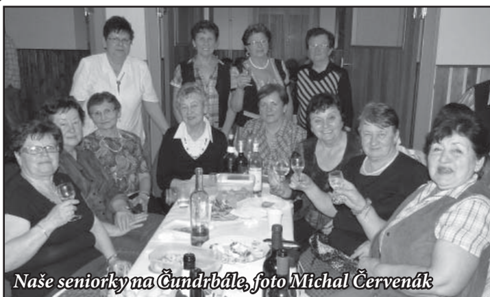
Naše seniorky na Čumdrbále