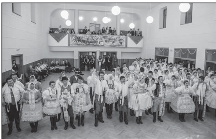
Krojovaný ples (foto P. Omelka)