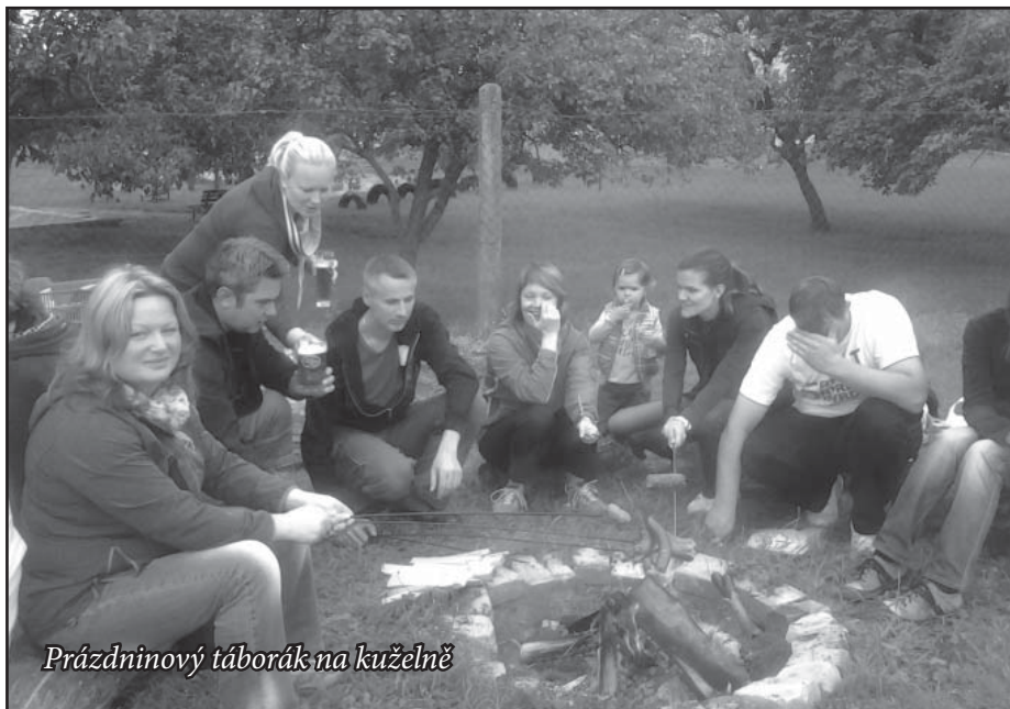
Prázdninový táborák na kuželně