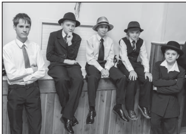
Školní akademie