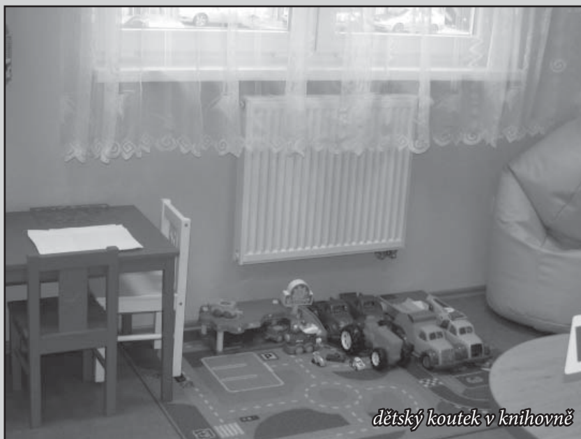
dětský koutek v knihovně