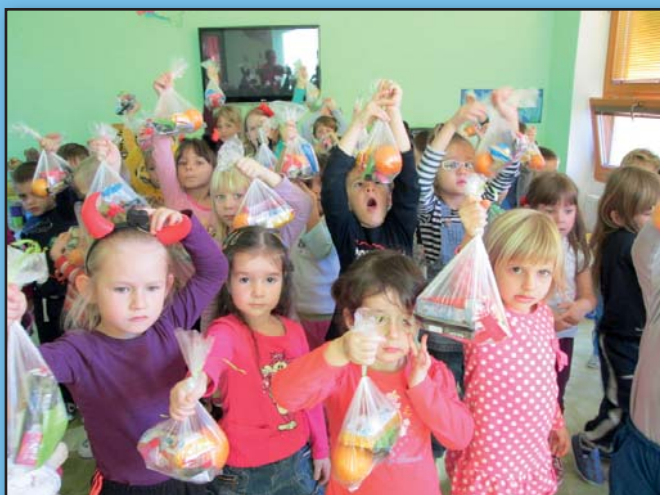
Mikulášská nadílka ve školce