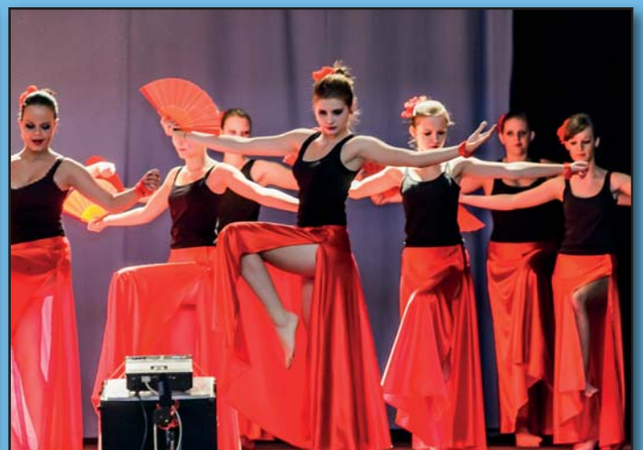
Školní akademie

Zpravodaj z Prušánek 4/2013 Vydává: Obecní úřad Prušánky Řídící redakční rada: odp. red. PaedDr. Jana Kamenská, členové: J. Hamrová, A. Zvědělíková. Redakční rada si vyhrazuje právo na krácení a úpravu článků. Grafická úprava a tisk: Petr Brázda - vydavatelství Uzávěrka pro Zpravodaj 1/2014 je 21. 3. 2014