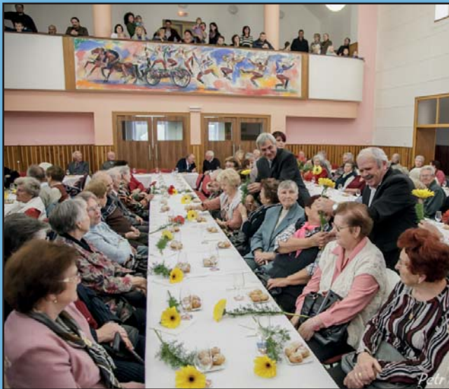
Beseda s důchodci