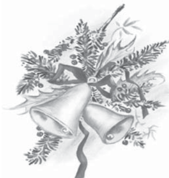
Čerti a andělé na mikulášské nadílce ve školce