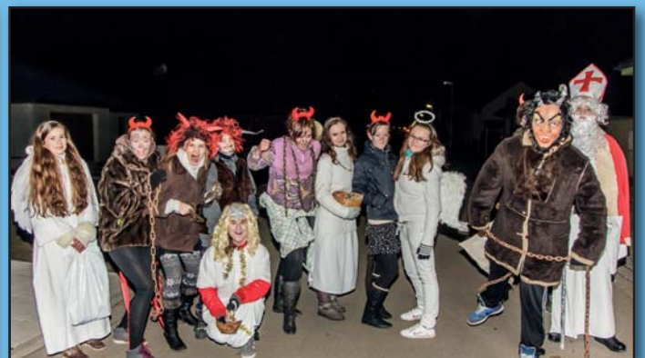
Mikuláš a čerti a andělé...