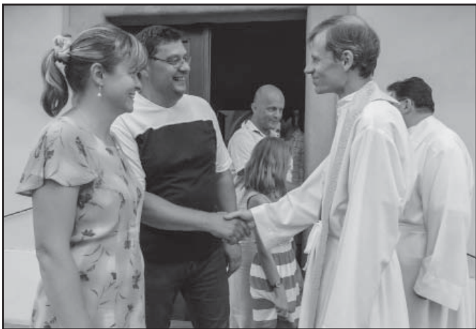
Přivítání nové p. faráře