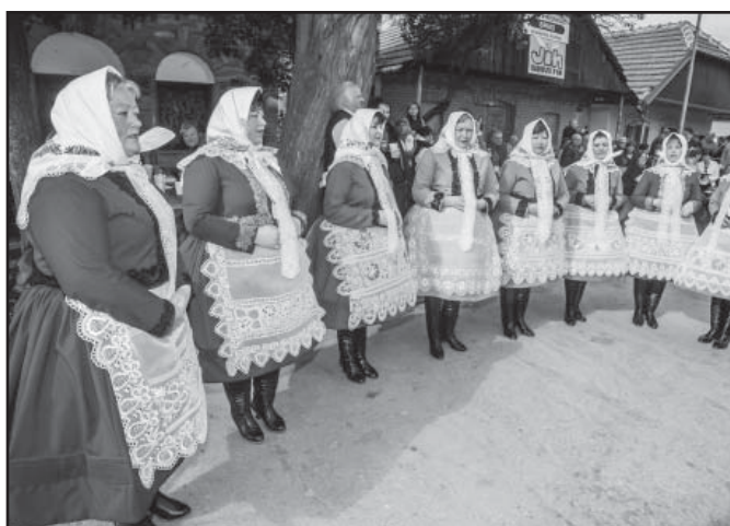
Ženský sbor...