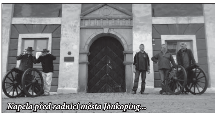
Kapela před radnicí města Jönköping...