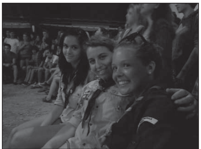
Skautský týden v Taizé, Francie