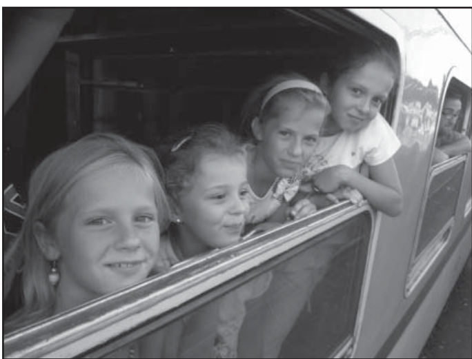
Výlet oddílu Cor Dare na Macochu