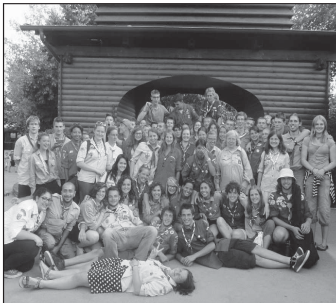
Skautský týden v Taizé, Francie