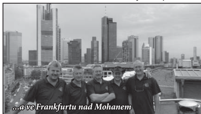
...a ve Frankfurtu nad Mohanem