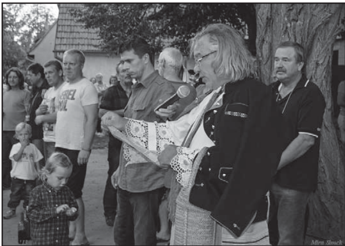
Vinobraní - čtení Horenského práva