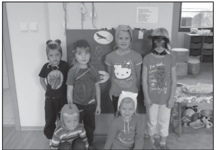
Začátek školního roku v MŠ