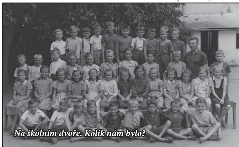
Na školním dvoře. Kolik nám bylo?