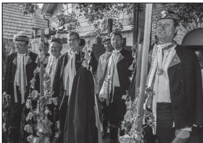
... a mužský sbor Slováckého krúžku