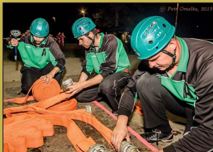
Příprava před závodem

Zpravodaj z Prušánek 3/2013 Vydává: Obecní úřad Prušánky Řídící redakční rada: odp. red. PaedDr. Jana Kamenská, členové: J. Hamrová, A. Zvědělíková. Redakční rada si vyhrazuje právo na krácení a úpravu článků. Grafická úprava a tisk: Petr Brázda - vydavatelství Uzávěrka pro Zpravodaj 4/2013 je 8. prosince 2013