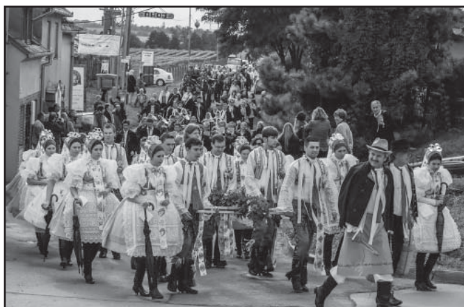
Průvod na vinobraní