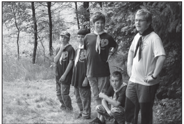
Tábor Polnička 2013