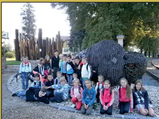
Čtvrtáci v KovoZOO