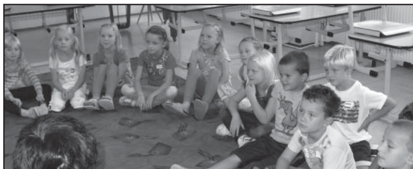
Poprvé ve třídě