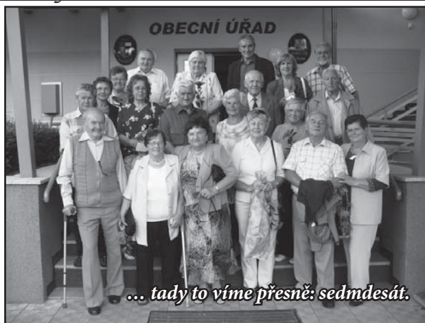
... tady to víme přesně: sedmdesát.