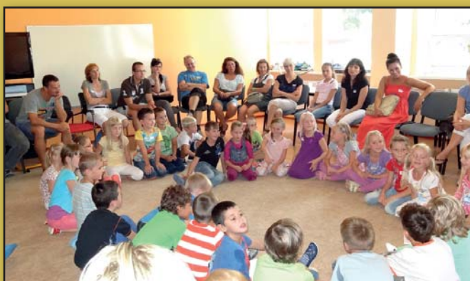
Prvňáčci se svými rodiči