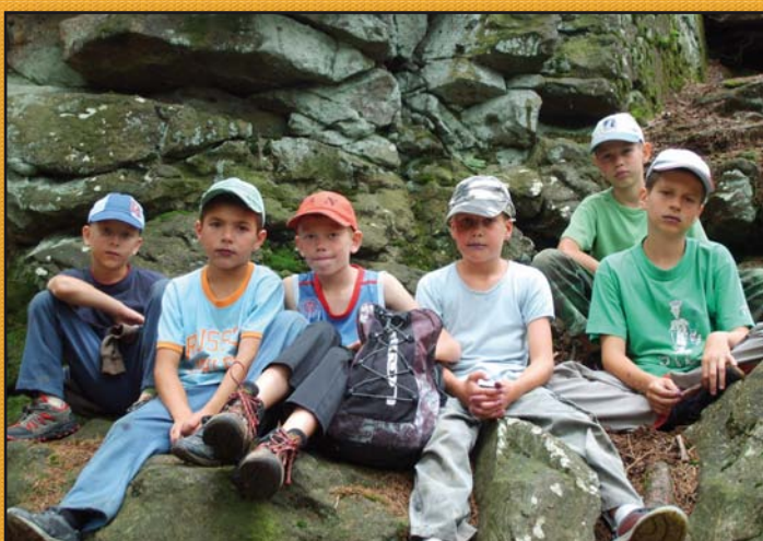
Skauti Mikulčice na táboře u Polničky