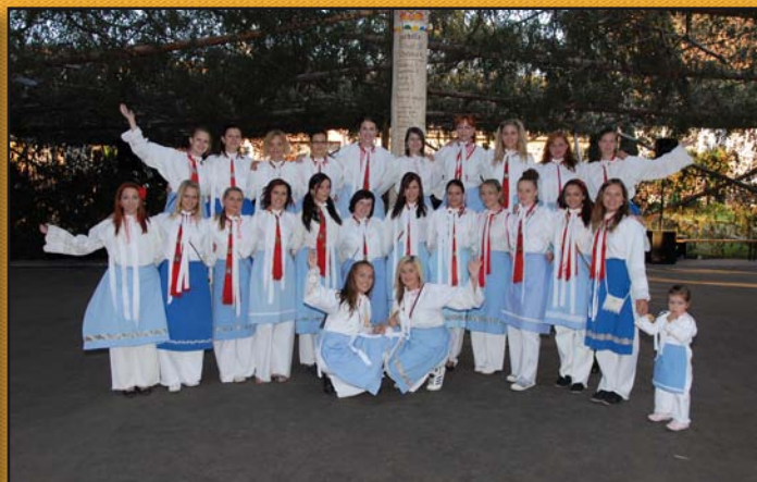
Hodové úterý