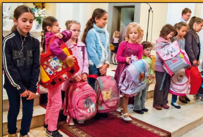
Žehnání aktovek v místním kostele

Prušánský zpravodaj 3/2012 Vydává: Obecní úřad Prušánky Řídící redakční rada: odp. red. PaedDr. Jana Kamenská, členové: J. Hamrová, V. Trechová, A. Zvědělíková, fotograf Ing. Petr Omelka Redakční rada si vyhrazuje právo na krácení a úpravu článků. Grafická úprava a tisk: Petr Brázda - vydavatelství Uzávěrka pro Zpravodaj 4/2012 je 5. prosince 2012