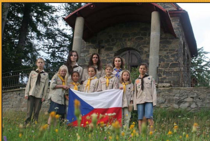
Skautky z oddílu Cor Dare na dívčím táboře