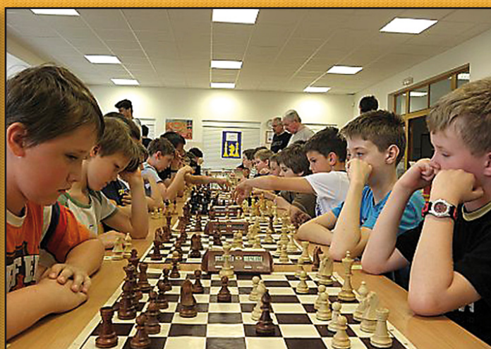
Naše šachové naděje