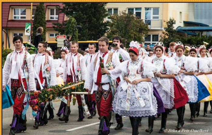
Krojovaný průvod na vinobraní