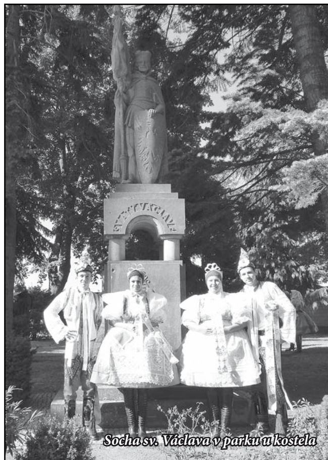
Socha sv. Václava v parku u kostela