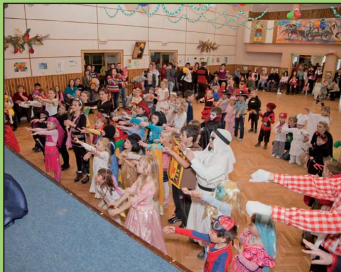
Dětský karneval, foto Ing. P. Omelka