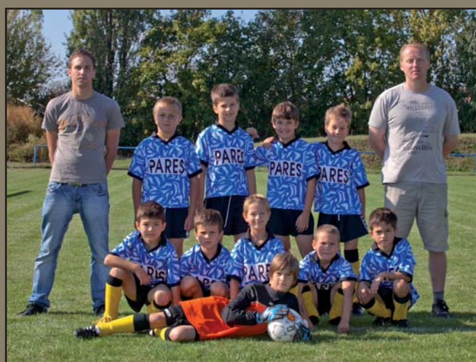
Naše fotbalové mláďi