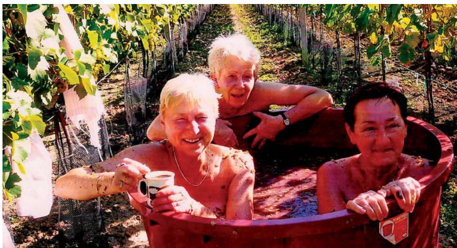
Vinná koupel ve vinici. I tak se žije ve Vrchních Nechorách...