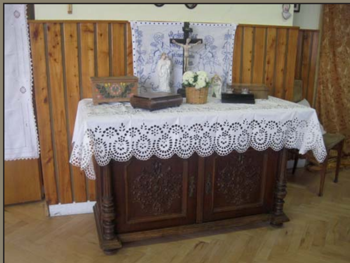
Výstava „Tradice a historie Prušánek“