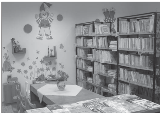
Nový dětský koutek v místní knihovně

Půjčovní doba: Út 8:00 - 17:00 Čt 8:00 - 16:00