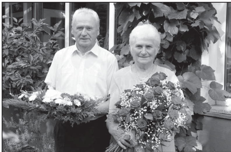
Manželé Kurkovi