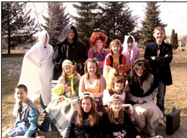
dramatický kroužek si připravil své první představení O smolíčkovi a jiných strašidlech

V termínu od 15.1. do 15.2. probíhají tradičně zápisy dětí do 1.třídy. V letošním roce jsme zapsali celkem 28 dětí (včetně těch, s odloženou školní docházkou z minulého roku). Na základě posouzení paní učitelek z MŠ a rodičů předpokládáme asi u šesti dětí s odložením školní docházky o jeden rok. Mimořádně nadané dítě s nástupem do školy před 6.rokem věku jsme nezaznamenali. Oproti loňskému roku „ubýlo“ dětí s odloženou školní docházkou.