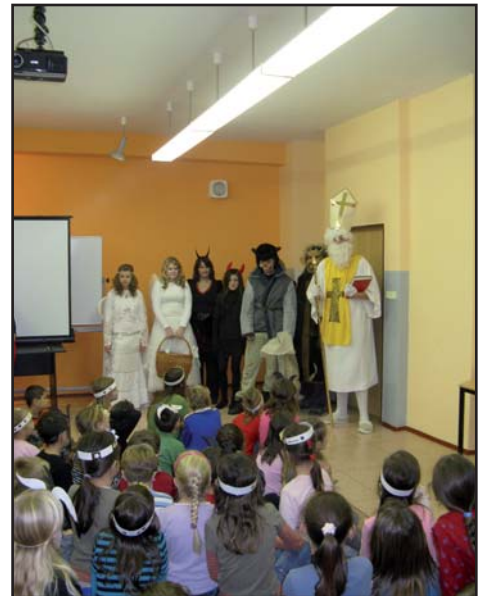
Mikulášský den ve škole

hezké sváteční chvíle v kruhu nejbližších o Vánocích, zdraví, štěstí a Boží požehnání do roku 2010.