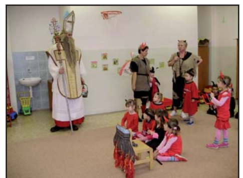
...přišel i Mikuláš

Doufám, že se v novém roce 2010 sejdem všichni ve zdraví a navíc ještě v nových prostorách mateřské školy.