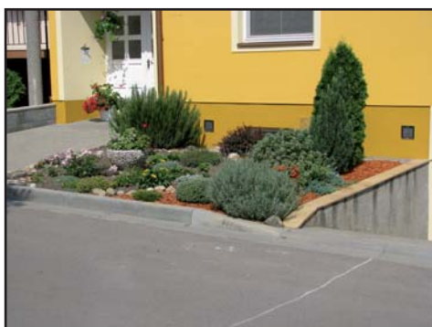
Simona Redková, ul. Příční