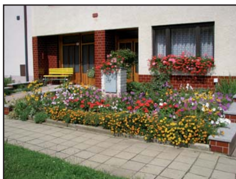
Blažena Kobzíková, ul. Hodonínská