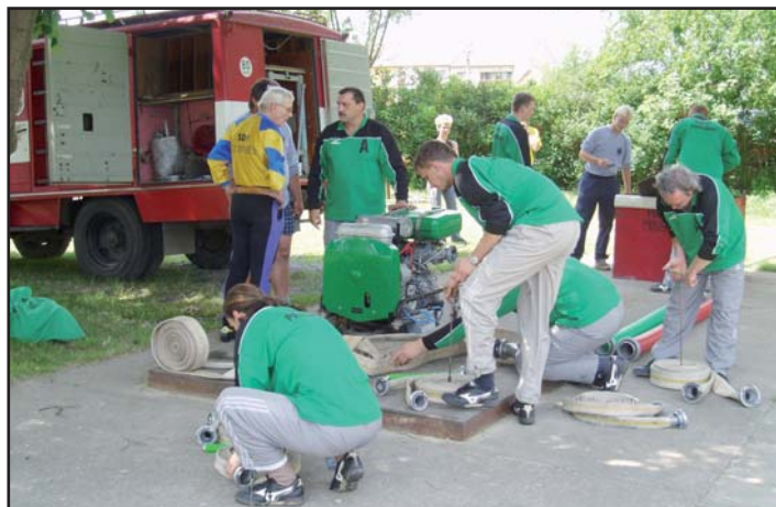
110. výročí SDH