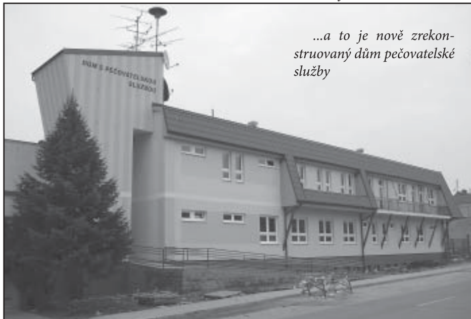
...a to je nově zrekonstruovaný dům pečovatelské služby