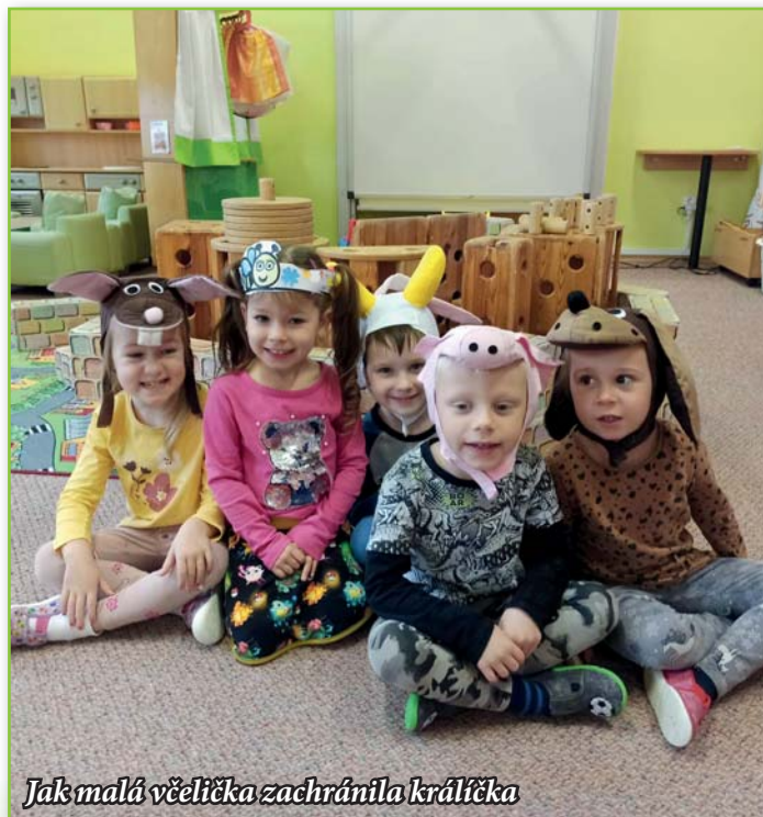
Jak malá včelička zachránila králíčka

Dobu masopustního veselí jsme oslavili jak jinak než karnevalem. Všem rodičům děkujeme za parádní kostýmy. Nejstarší děti byly na edukativním programu v ZOO Hodonín „Proč plazi jazyk plazí“ a ti odvážní si mohli hada i pohladit. Pro všechny děti byl uskutečněn projektový den