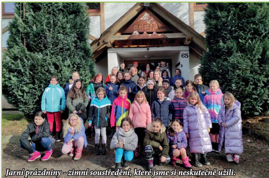
Jarní prázdniny - zimní soustředění, které jsme si neskutečně užili.