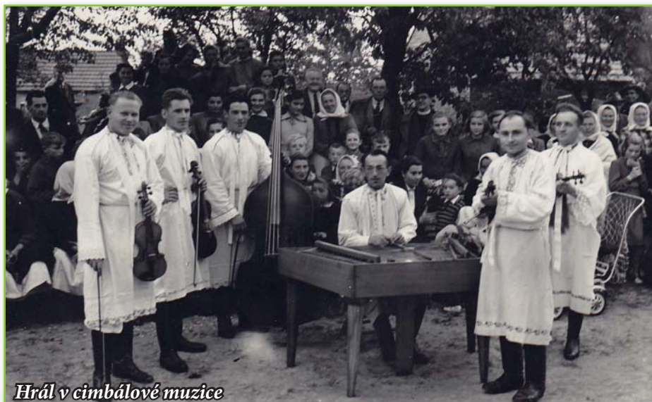
Hrál v cimbalové muzice

V 70. a 80. letech učil hlavně v Lužicích, v Moravském Žižkově a v Prušánkách. Kromě toho také dělal průvodce německým zájezdům. (tehdejší družba s JZD). V roce 1983 šel do důchodu. I v důchodu byl stále aktivní. Začal vypomáhat varhanici v kostele. Postupně se stal hlavním varhaníkem a vedl i chrámový sbor až do roku 2012. Dělal také vrátného V Naftě v Hodoníně, pracoval pro hodonínské muzeum a zpracovával různé články. Jeho posledním zaměstnáním bylo