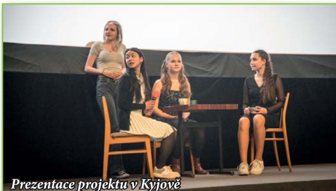
Prezentace projektu v Kyjově